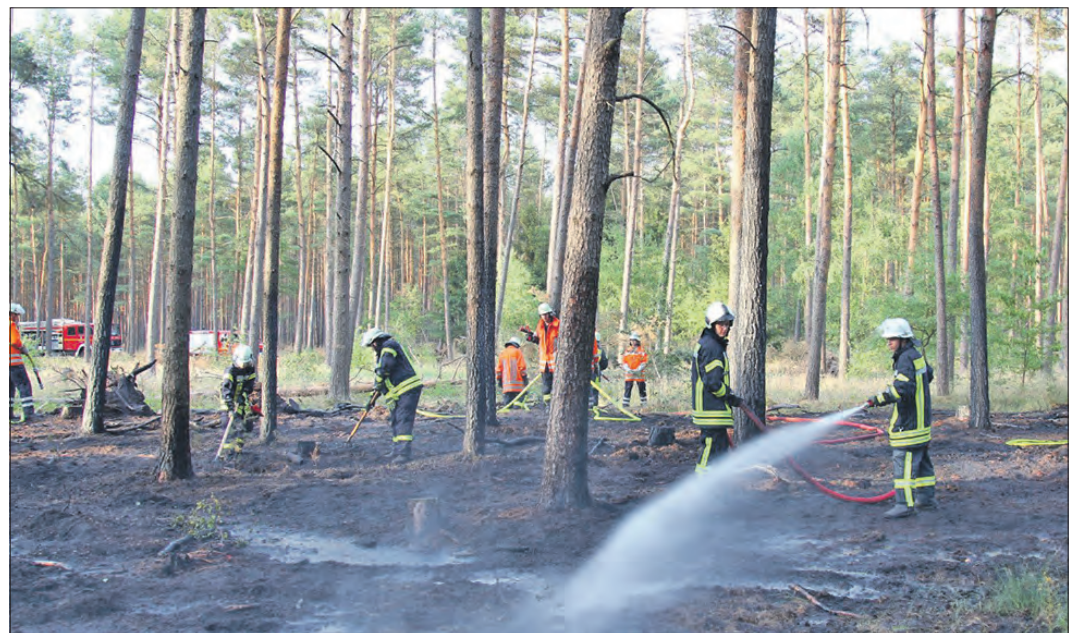
In den vergangenen Tagen mußten die Freiwilligen Feuerwehren mehrfach zu Waldbränden ausrücken.

Am Mittwochabend gegen 19 Uhr brannte es dann erneut in der Ahrensheide. Nicht allzu weit von der Einsatzstelle des Vortages standen etwa 400 Quadratmeter Unterholz in Flammen. Die Feuerwehren aus Bierde, Böhme, Rethem, Hodenhagen, Ahlden und Krelingen löschten auch diesen Brand. Das nötige Wasser wurde mit Tanklöschfahrzeugen im Pendelverkehr zur Einsatzstelle gebracht. Hilfe erhielten die Ehrenamtlichen wieder durch ortsansässige Landwirte. „Die Zusammenarbeit klappt hervorragend,