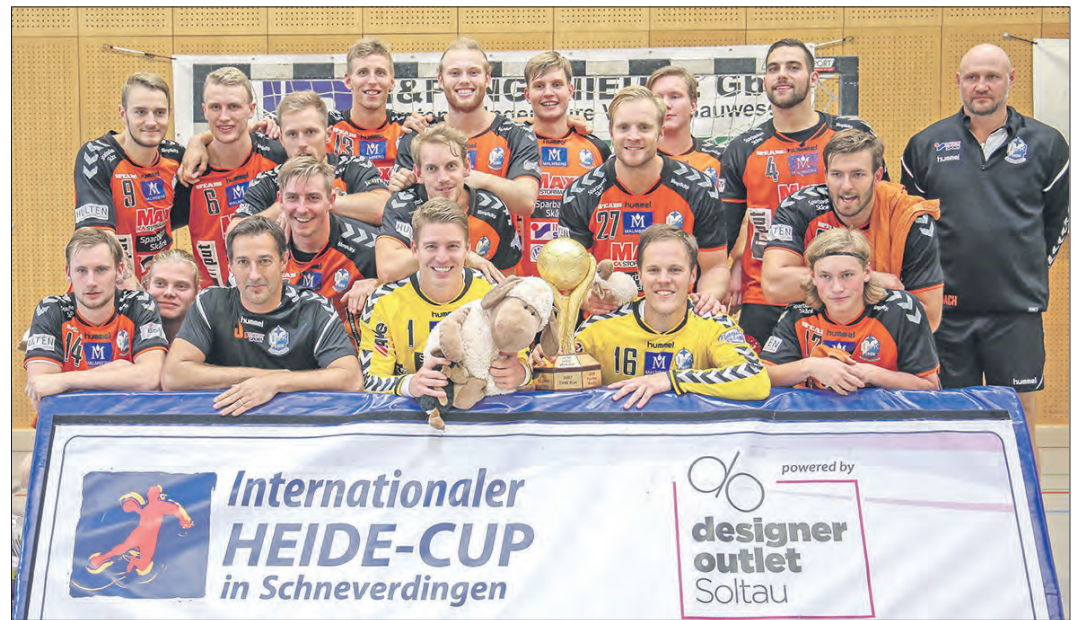
Will den Cup verteidigen: Vorjahressieger IFK Kristianstad aus Schweden.