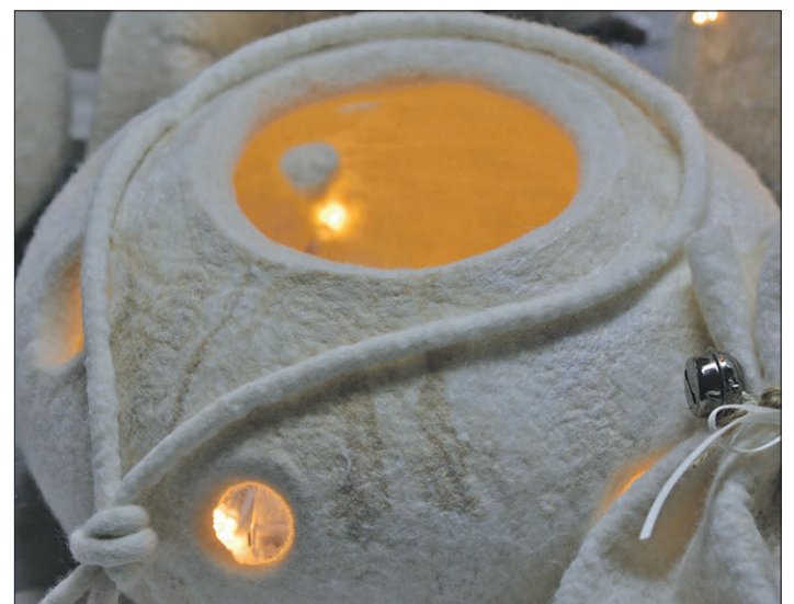
Auch das ist Filz: eine stimmungsvolle Lichtkugel.

Kurse sind so gefragt, daß schon Zusatztermine angesetzt werden mußten. Interessierte sollten sich schnell anmelden, um noch einen Platz zu erhalten. Genaue Informationen zu den einzelnen Kursinhalten und -terminen sind auf der Internetseite des Filznetzwerks unter www.filznetzwerk.de zu finden. Die Anmel-