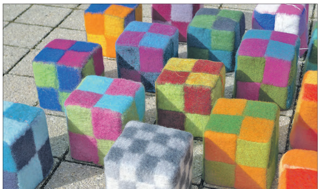
Filz ist vielseitig und läßt sich zu den verschiedensten Objekten verarbeiten.

Filzkolleg 2018 zu Gast in Soltauer Felto: Jetzt anmelden