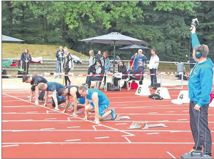
120 Helferinnen und Helfer sowie Kampfrichterinnen und Kampfrichter sorgten bei den Landesmehrkampfmeisterschaften in Munster für einen reibungslosen Ablauf.

MUNSTER. Mit den Sportvereinen SV Munster, VfB Munster, Breloher SC und Schützengilde Breloh sowie dem Allwetterbad Munster hat sich die Stadt Munster vor kurzem einmal mehr als „Stadt des Sports“ präsentiert. Der Niedersächsische Turner-Bund richtete seine diesjährigen Landesmehrkampfmeisterschaften mit den Jahn-Wettkämpfen, Deutschen Mehrkämpfen, Friesenkämpfen, leichtathletischen Mehrkämpfen, Schleuderballweitwurf, Steinstoßen und schwimmerischen Mehrkämpfen aus - und das zum ersten Mal in Munster. Mit 230 Teilnehmern aus ganz Niedersachsen waren etwas weniger Aktive als in den Vorjahren am Start. Für einen reibungslosen Ablauf sorgten in den fünf Wettkampfstätten etwa 120 Helfer und Kampfrichter. Die erforderlichen Sportgeräte wurden von Jugendfeuerwehr Munster/Breloh aus Walsrode, Schneverdingen, Oker, Hannover und Salzgitter in die Örtzestadt transportiert.