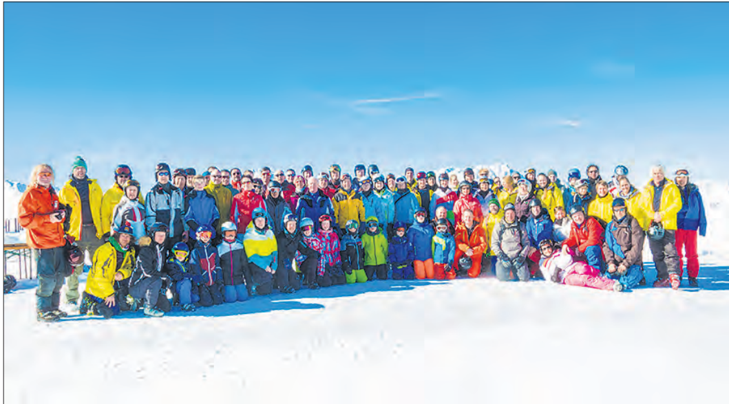
Spaß auf der Piste hatten die Skifahrer und Snowboarder bei der Skifreizeit in Ischgl.