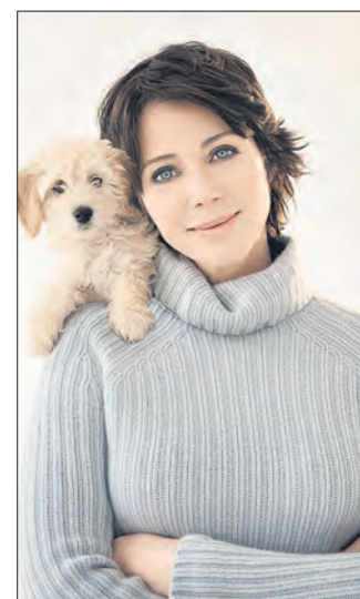
„Hilde - Mein Leben als Frauchen“ heißt die Show zum Buch von Ildikó von Kürthy.

SOLTAU. „Hilde“ heißt der neue Bestseller von Ildikó von Kürthy. Begleitend zum Buch ist die Autorin aktuell mit ihrer Live-Show „Hilde - Mein Leben als Frauchen“ auf Tour und macht am Donnerstag, dem 19. April, in der Böhme Stadt Station: Ab 20 Uhr steht sie in der Aula des Gymnasiums Soltau auf der Bühne - und das nicht allein: Begleitet wird sie bei der Aufführung ihres amüsanten Programms lautstark von einem prominenten Überraschungsgast. Der Heide-Kurier verlost für diesen Auftritt dreimal zwei Freikarten.