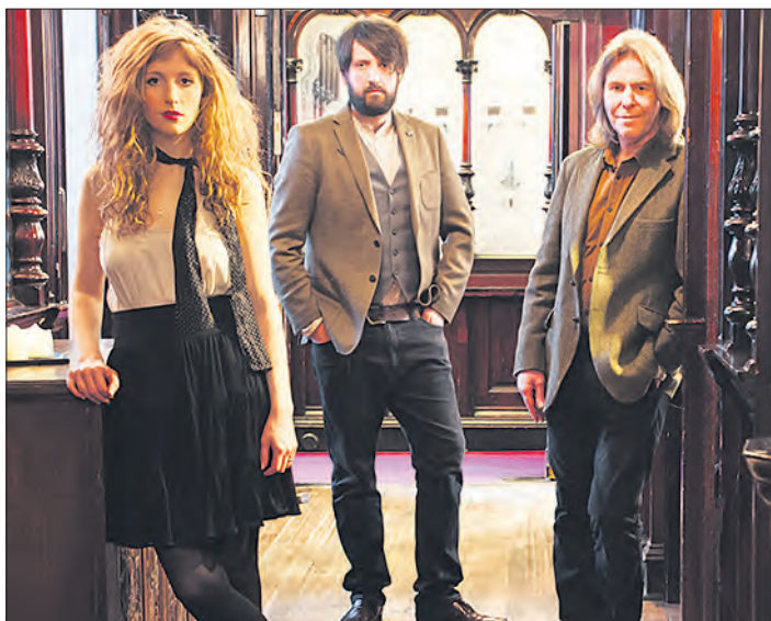
„Ashton Lane“ kommt am 11. April nach Schneverdingen.

SCHNEVERDINGEN. In der Veranstaltungsreihe „La Habana live“ präsentiert der Kulturverein Schneverdingen am Mittwoch, dem 11. April, ab 20 Uhr das Trio „Ashton Lane“. Auf dem Programm steht dann eine Mischung aus Indie Pop und Americana - aus Schottland.