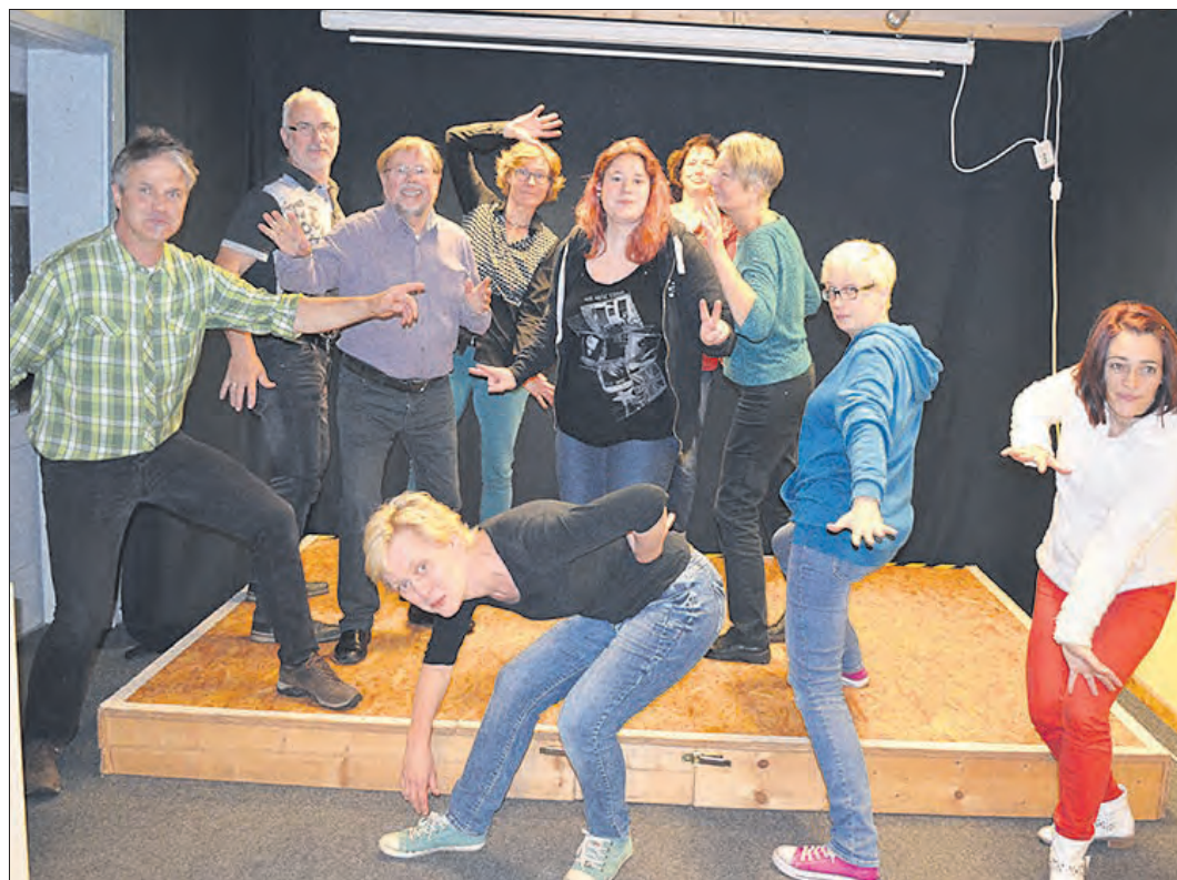
Tritt am 13. April in der Soltauer „Kantine“ auf: die Improvisationstheatergruppe „Betreutes Impro“. Am folgenden Tag gibt es einen Workshop.

Gruppe am 13. April in der Soltauer „Kantine“ / Workshop