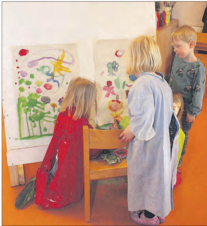
Das Hamburger Raumgestaltungskonzept im Schneverdingen Lütenhof: Kinder der Kita, die gern malen möchten, können sich an der Staffelei im „Atelier“ ausprobieren.

Nach dem Morgenritual aber können sich die Kinder auf die ihnen angebotenen räumlichen Möglichkeiten verteilen. Sie selbst überlegen, ob sie lieber Turnen oder Malen wollen, Bauen oder Matschen - sofern in dem entsprechenden Raum noch Kapazität ist. Die Höchstgrenze - unterschiedlich nach den Räumlichkeiten - ist festgelegt; jedes Kind, das dort mitmachen möchte, heftet sein Foto als „Eintrittskarte“ an den Türrahmen, so daß auch die Drei- bis Sechsjährigen schnell erkennen kön-