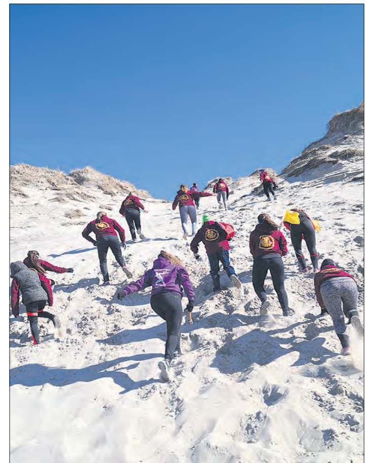
Spuren im Sand: In den regelmäßigen Läufen war eine Düne mit 22 Metern Höhenunterschied zu überwinden.

Die Eltern, Familienangehörigen sowie Freunde und Bekannte der nach Dänemark gereisten Leichtathleten konnten teilweise wieder live auf Facebook und Instagram das Trainingslager verfolgen und Fotos anschauen. Bei einem gemeinsamen Strandspaziergang am letzten Abend wurde beschlossen, auch im kommenden Jahr wieder ein Trainingslager zu absolvieren.