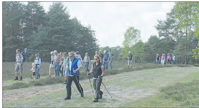
Zur nächsten Vier-Jahreszeiten-Wanderung lädt der TuS Hermannsburg für den 22. April ein.

Pünktlich um 13.30 Uhr geht es los. Alle Teilnehmer entscheiden selbst, ob sie die vier, acht oder zwölf Kilometer langen Strecke in Angriff nehmen möchten. Nach dem langen Winter hoffen die Organisatoren des TuS Hermannsburg nun umso mehr auf milde Luft und eine aufblühende Natur.