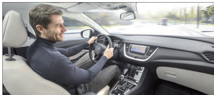
Ein rückengerechter Sitz alleine reicht nicht. Er muss so eingestellt sein, dass die Schulterblätter immer an der Rückenlehne anliegen - auch beim Lenken.

Druck auf der Wirbelsäule, wodurch Rückenmuskeln und Bandscheiben in Mitleidenschaft gezogen werden. Richtiges, ergonomisches Sitzen hingegen bedeutet: Nicht der Körper muss sich dem Sitz anpassen, sondern andersherum. Der Autositz sollte den individuellen Bedürfnissen des Fahrers oder Beifahrers gerecht werden. Darüber hinaus gibt es Funktionen, die den Komfort erhöhen. So zum Beispiel ein Klimapaket mit Sitzheizung und Ventilation, einstellbare Seitenwangen an Rücklehne und Sitzkissen oder eine Massagefunktion.