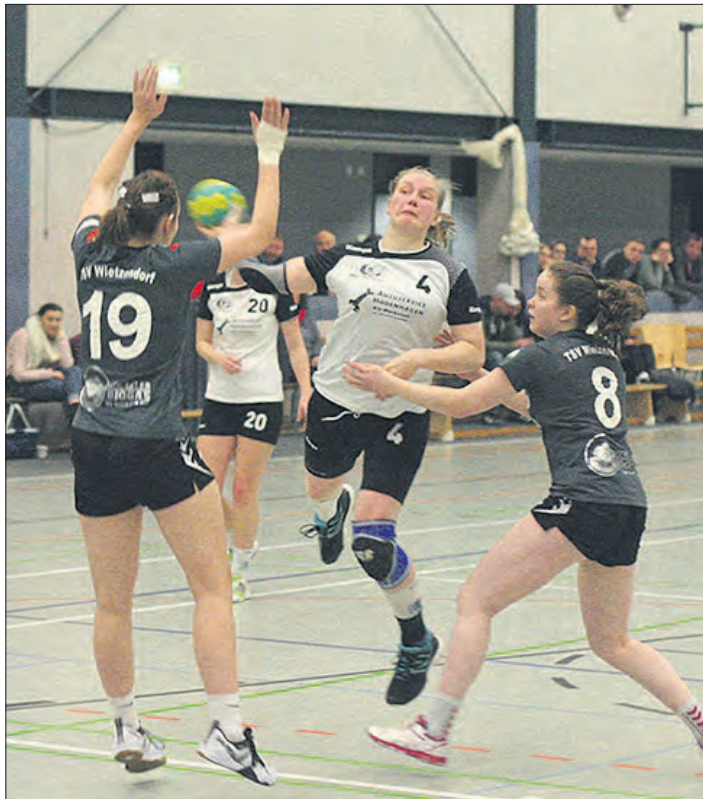
Während die Handballerinnen der HSG Heidmark II (weiße Trikots) heute in der Landesliga auf den SV Garßen-Celle II treffen, spielen die Wietzendorfer Damen (dunkle Trikots) gegen den TuS Oldau/Ovelgönne.

HEIDEKREIS (tke). Am heutigen Sonntag treffen die Handball-Herren des MTV Soltau II ab 15.15 Uhr im Landesliga-Heimspiel auf den TV Uelzen. Gegen den Tabellennachbarn wollen die Böhmestädter den knappen 27:26-Hinspielerfolg bestätigen und damit die eigene Punktebilanz wieder ausgleichen. Das TVU-Team schwebt als Neunter weiterhin in Abstiegsgefahr und wird daher sicherlich hoch motiviert in Soltau antreten. Während sich die Mannschaft von Trainer Olaf Schröder zuletzt sehr schwankend präsentierte, da immer wieder Akteure an die „Erste“ abgegeben wurden, holte Uelzen 4:4-Zähler aus den vergangenen vier Auswärtsspielen. Daher wird diese Partie keine leichte Hürde für die Soltauer Reserve werden, die sich aber dennoch behaupten sollte.