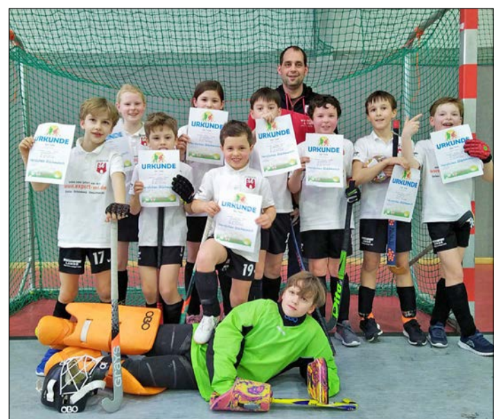
Belegten in Mellendorf den 2. Platz: die Hockey-Knaben C vom MTV Soltau.