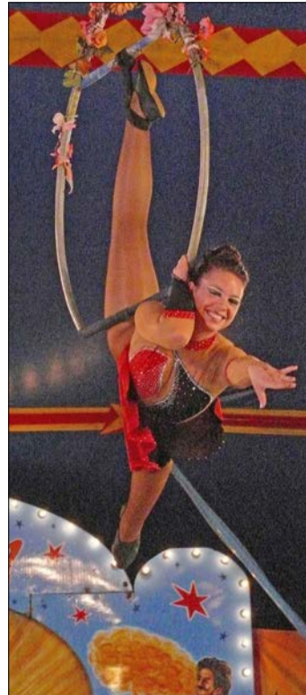
Der Zirkus May gastiert in der Böhme Stadt.

Die großen und kleinen Zuschauerinnen und Zuschauer, die wieder einmal Zirkusluft schnuppern möchten, dürfen sich auf eine abwechslungsreiche Darbietung freuen: Sie können bei der Hochseilartistik mitfiebert, den Tellerjongleuren bewundern und zusammen mit der „Zielperson“ beim Messerwerfen zittern. Darüber hinaus geben sich Tiere wie Lamas und andere Kamelarten, aber auch Riesenschlangen im Zirkus ein Stelldichein - ein vielfältiges Programm also mit Tieren und Artisten.