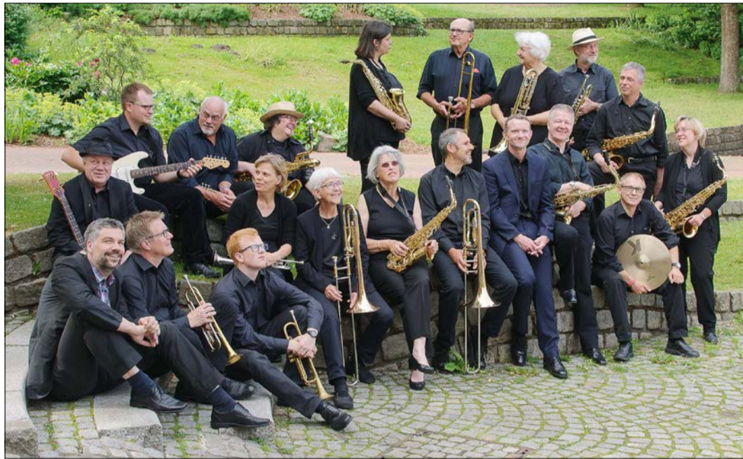
Auch die VHS-Big-Band ist beim Festival wieder mit dabei, diesmal in Soltau.

Festival geht diesmal in Soltauer Aula über die Bühne