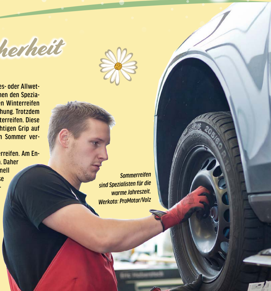
Sommerreifen sind Spezialisten für die warme Jahreszeit.

geräuschen und Rollwiderstand. Ganzjahres- oder Allwetterreifen bilden einen Kompromiss zwischen den Spezialisten. In ihren Eigenschaften sind sie den Winterreifen näher, etwa bei der weicheren Gummimischung. Trotzdem haben sie weniger Lamellen als echte Winterreifen. Diese feinen Rillen im Profil sorgen für den richtigen Grip auf vereisten oder verschneiten Straßen. Im Sommer verschleißt Ganzjahresreifen viel schneller als Sommerreifen. Am Ende müssen sie häufiger gewechselt werden. Daher ist der vermeintliche Kostenvorteil schnell weggeschmolzen. Wer auf kompromisslose Sicherheit setzt, sollte daher den Spezialisten den Vorzug geben: Sommerreifen im Sommer, Winterreifen im Winter. Als Faustregel für den Wechsel gilt „von Ostern bis Oktober“. Sobald die Temperaturen dauerhaft über sieben bis zehn Grad liegen ist es Zeit, sich um den Zustand der Reifen zu kümmern und einen Termin in der Werkstatt zu machen.