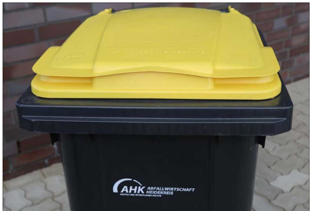
Anthrazitfarbener Behälter, gelber Deckel. So sehen die 240-Liter-Tonnen aus, die bereits Ende dieses Jahres an die Haushalte verteilt werden sollen.

In Niedersachsen gibt es zehn zugelassene duale Systeme. Diese Unternehmen gewährleisten, dass Glas, Papier, Pappe, Karton sowie