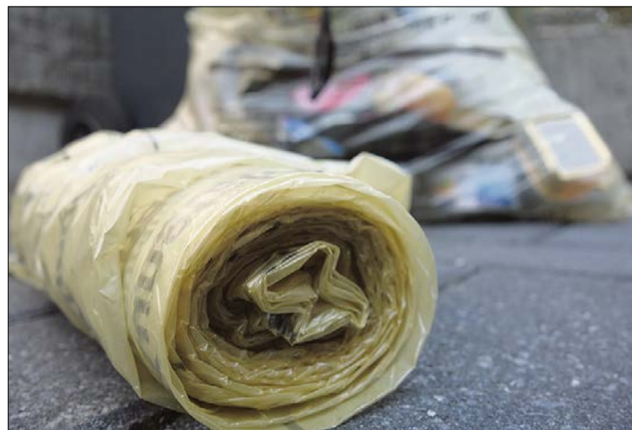
Sollen bei der Sammlung und Entsorgung von Verpackungsmüll schon im kommenden Jahr keine Rolle mehr spielen: die gelben Säcke.

Die AHK kann sich vorstellen, dass unter ihrer Regie aus der Verpackungstonne zu einem späteren Zeitpunkt eine Wertstofftonne wird, in die dann sowohl Leichtverpackungen als auch sogenannte stoffgleiche Nichtverpackungen wie zum Beispiel Küchenschüsseln aus Kunststoff hineingeworfen werden können. Dies soll von der weiteren Entwicklung bei der Verwertung von Kunststoffabfällen in Deutschland abhängig gemacht werden. Zunächst aber gehe es ausschließlich um Verpackungsmüll, so Schäfer. Der Zeitraum der Ausschreibung erstreckt sich über drei Jahre. Der AHK-Vorstand rechnet damit, dass das Vergabeverfahren im Sommer dieses Jahres abgeschlossen sein wird. Wie auch immer dieses ausgehe: „Klar ist, die gelbe Tonne kommt.“