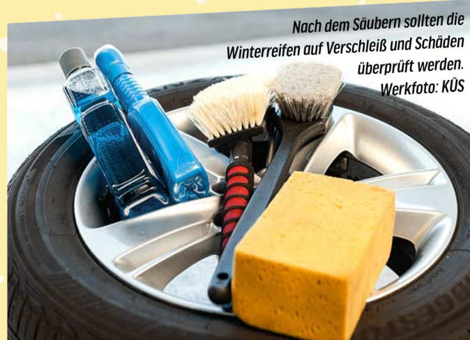
Nach dem Säubern sollten die Winterreifen auf Verschleiß und Schäden überprüft werden.

DOT-Kennzeichnung. Die ersten zwei Ziffern stehen für die Kalenderwoche, die hinteren für das Produktionsjahr der Reifen. Vor dem Einlagern der Pneus sollte der Luftdruck leicht erhöht werden, um etwa 0,5 bar. Dann sind die Räder bereit, in einem trockenen und dunklen Raum auf den nächsten Einsatz zu warten. Hierzu gibt es auch praktische und schonende Felgenbäume, mit denen die Reifen ohne Druck auf den Flanken gelagert werden können.