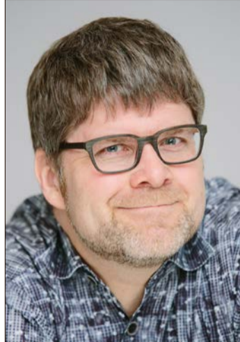
Theologe, Kabarettist und Autor Fabian Vogt.

An diesem Abend soll es um nicht weniger gehen als die menschliche Grundfrage: Kommt nach dem Tod noch irgendwas? Schließlich finden sich dazu in jeder Kultur faszinierende Bilder und Geschichten - von der Wiedergeburt bis hin zur Apokalypse. Fabian Vogt hat 100 davon gesammelt und bittet nun zu einem Streifzug durch „hoffnungsvolle, furchterregende und kuriose Jenseitsvorstellungen aus aller Welt“. Dies soll auch eine Einladung sein