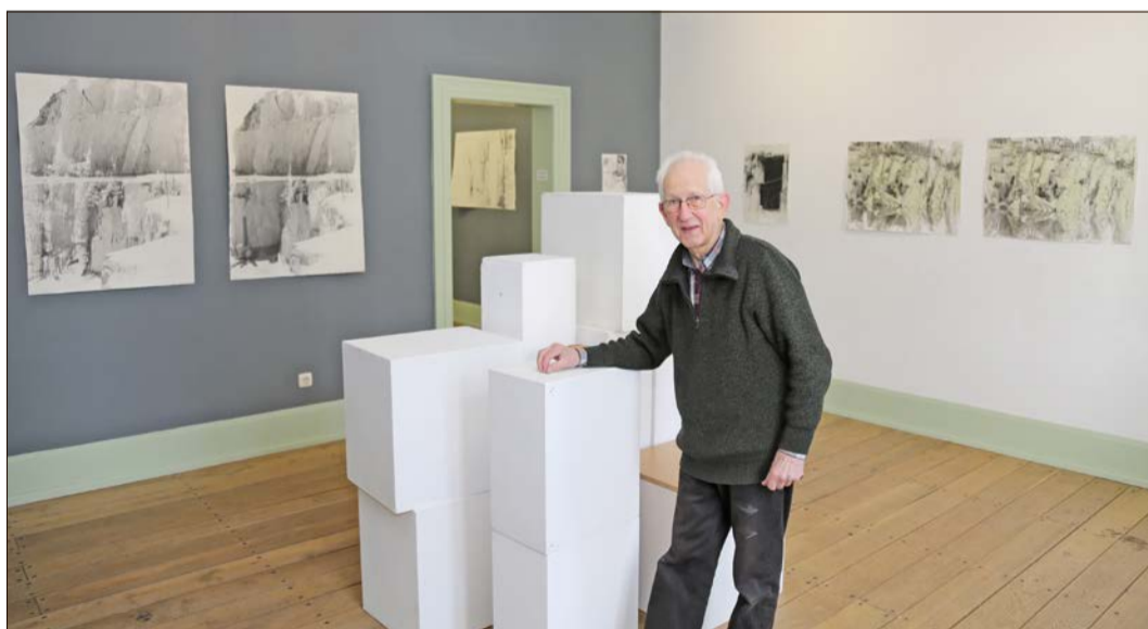
„Brüche“ heißt die Ausstellung, bei der Künstler Hawoli vom 9. März bis zum 14. Juni im Soltauer Museum eine Auswahl seiner Fotoarbeiten zeigt.

Künstler Hawoli zeigt Fotoarbeiten im Soltauer Museum