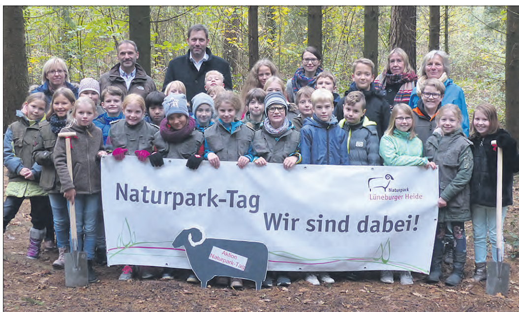
Rund 90 Schüler der GOBS Neuenkirchen und der SPD-Bundestagsabgeordnete Lars Klingbeil entkusselten zum Auftakt des Naturpark-Tages in der Riensheide.