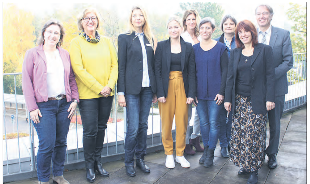
Informierten über die Frauenberufsbörse, die am 20. November in Walsrode auf dem Programm steht: Einige der Organisatorinnen und Landrat Manfred Ostermann.

SOLTAU/WALSRODE (mk). Frauen, die nach der Elternzeit oder der Pflege Angehöriger wieder in den Beruf einsteigen wollen, Migrantinnen, die ihre Sprachkenntnisse verbessern möchten und einen Job suchen, Frauen, die anpeilen, sich beruflich weiterzubilden und für höhere Aufgaben zu qualifizieren – für alle Interessierten gibt es am 20. November von 9 bis 12.30 Uhr im evangelischen Gemeindehaus in Walsrode, Am Kloster 1, erstmalig eine Frauenberufsbörse im Heidekreis. Im Zuge dieses Gemeinschaftsprojekts, das mehrere Institutionen initiiert haben, stellen sich die verschiedensten Einrichtungen mit ihren Beratungs- und Unterstützungsangeboten vor. Am gestrigen Dienstag präsentierten die Initiatorinnen sowie Landrat Manfred Ostermann im Soltauer Kreishaushaus das Programm und stellten die einzelnen Schwerpunktangebote vor.