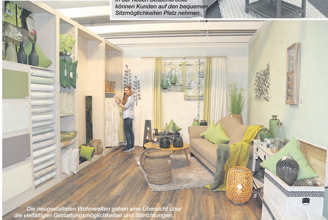
Die neugestalteten Wohnwelten geben eine Übersicht über die vielfältigen Gestaltungsmöglichkeiten und Stilrichtungen.