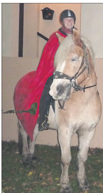
St.-Martin hoch zu Pferd erfreut die Kinder in Schneverdingen.

SCHNEVERDINGEN. Am kommenden Sonntag ist Martinstag. Deshalb gibt es in Schneverdingen eine Feier für Kinder, die an das Wirken des Heiligen erinnert. Beginn ist um 17.30 Uhr in der evangelischen Peter-und-Paul-Kirche, nach einem Laternenumzug gibtes im Garten der katholischen St.-Ansgar-Kirche einen gemütlichen Ausklang bei Lagerfeuer und Punsch.