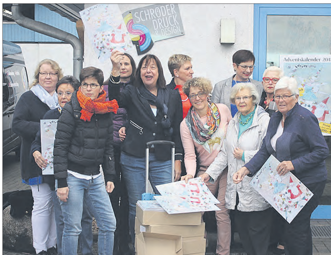
Präsentieren den neuen Adventskalender: die Damen des Inner-Wheel-Clubs Soltau-Walsrode.

Neuer Adventskalender vom Inner-Wheel-Club