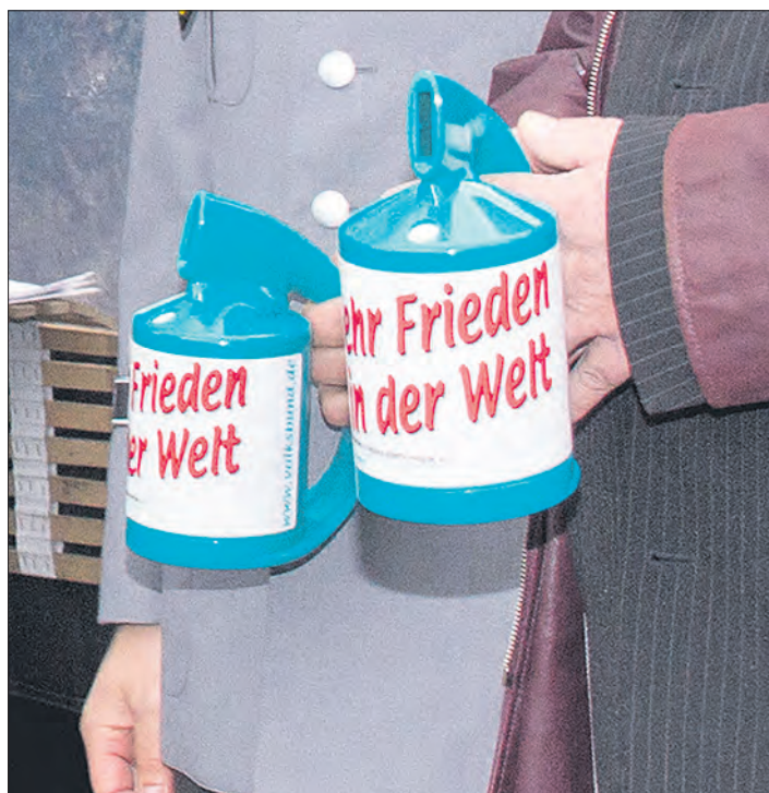
Arbeit für den Frieden: Der Bundeswehrstandort Faßberg unterstützt auch in diesem Jahr die Haus- und Straßensammlung des Volksbundes Deutsche Kriegsgräberfürsorge.