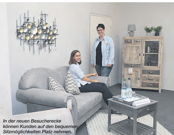
In der neuen Besucherecke können Kunden auf den bequemen Sitzmöglichkeiten Platz nehmen.

außerdem eine Vertreterin der Firma Vorwerk zu Gast, die Interessierten den Thermomix und dessen vielfältige Möglichkeiten vorstellt.