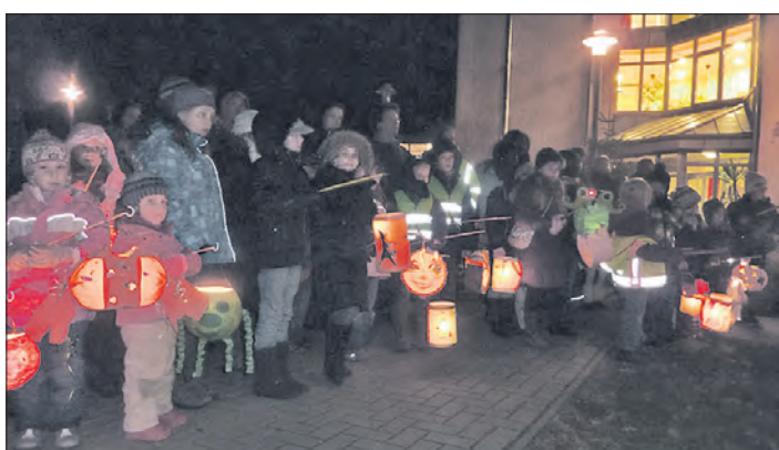
Leuchtende Laternen bei den Hausgemeinschaften Wiesentrift.

Dort gibt es auf dem Kirchplatz Lagerfeuer und Punsch. Auch die Kirche ist zur Besichtigung, zum Anzünden einer Kerze und zum Gebet geöffnet. Für musikalische Begleitung sorgen die Jungbläser der evangelischen Kirchengemeinde.