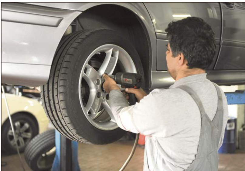
Bei kleinen Routinearbeiten wie einem Öl- oder Reifenwechsel sollte mit der Werkstatt ein Festpreis vereinbart werden.

Ist es für die Werkstatt schwierig abzusehen, welche Arbeiten überhaupt zu erledigen sind, ist eine Kostenobergrenze hilfreich. Dies gilt auch für eine möglicherweise zeitintensive Fehlersuche. Ist die Obergrenze erreicht, muss die Werkstatt den Auftraggeber fragen, bevor sie weiterarbeitet. Bei kleinen Routinearbeiten wie einem Öl- oder Reifenwechsel empfiehlt es sich, einen Festpreis zu vereinbaren.