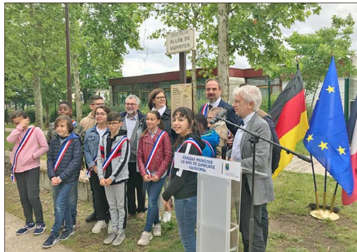
Auch das Jugendparlament Eragnys war beim Festakt in der französischen Partnerstadt vertreten.