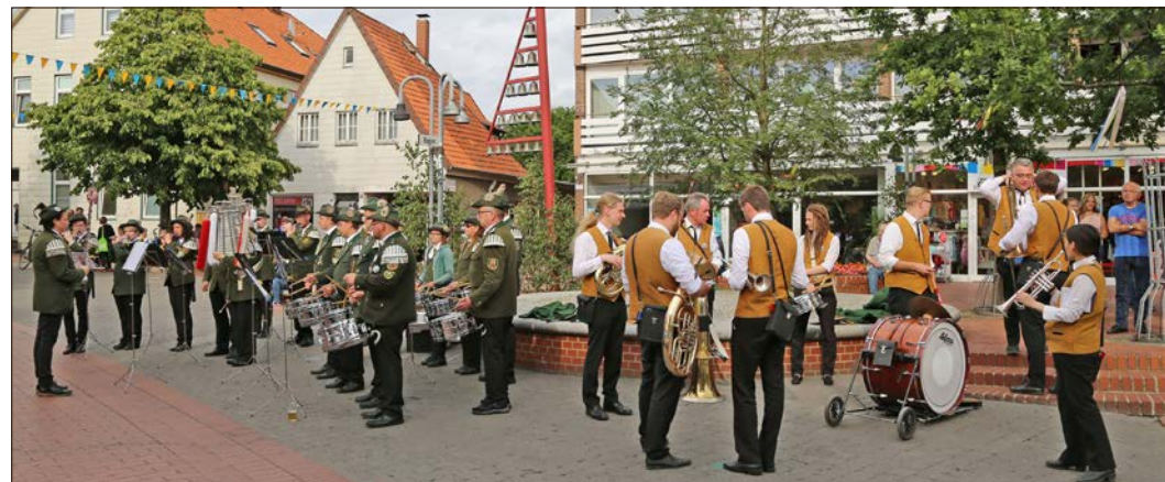
Das Soltauer Schützenfest startete am vergangenen Donnerstag mit einem Platzkonzert.

Telefon 05191 9832-0 redaktion@heide-kurier.de