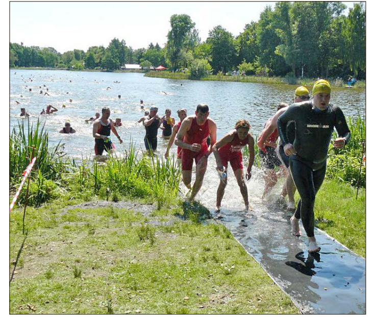
Das Schwimmfinale am Heidesee beim Triathlon Müden.

MÜDEN. Am heutigen Sonntag, dem 7. Juli, ist es wieder soweit: Um 14 Uhr fällt am Heidesee in Müden fällt der Startschuß zum nunmehr 30. Volkstriathlon.