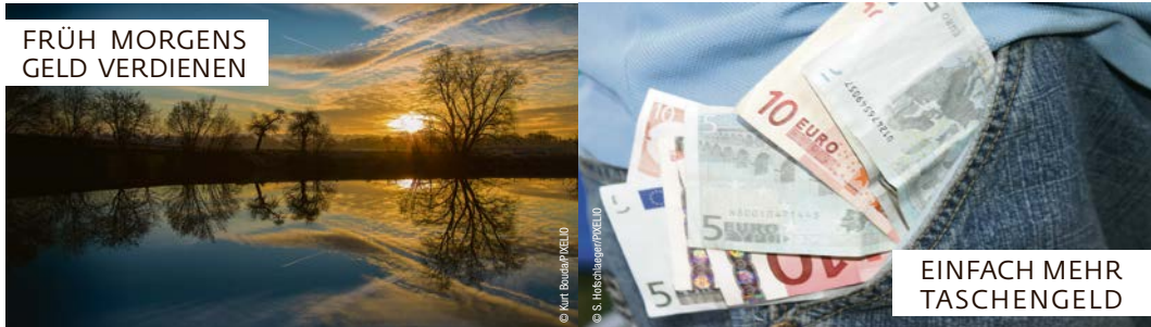
FRÜH MORGENS GELD VERDIENEN