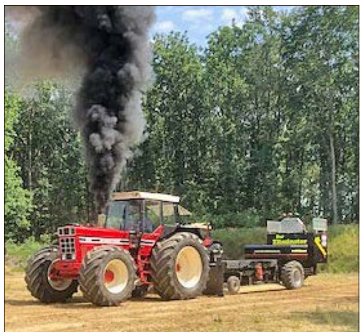
Am 13. und 14. Juli geht in Behringen der diesjährige „Trecker Treck“ über die Bühne.

An beiden Tagen gibt es ein Programm für die ganze Familie, auch das leibliche Wohl soll nicht zu kurz kommen.