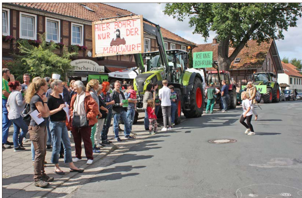
Traktor, Transparente und Sprechchöre: Das Aktionsbündnis gegen Gasbohren hatte in Dorfmark zur Demonstration aufgerufen.

Walsroder Straße einbiegen“, erläuterte Rothardt. Das Auto habe die Unbekannte erfaßt, die die Fritz-Reuter-Straße queren wollte, vorher allerdings gewartet haben soll. Sie wird als etwa 40 Jahre alt, schlank, groß, mit sehr dunklen, kurzen Haaren beschrieben. Die Frau und Zeugen des Vorfalls werden gebeten, sich bei der Polizei in Soltau unter der Rufnummer (05191) 93800 zu melden.