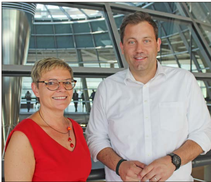
Die gesundheitspolitische Sprecherin der SPD-Bundestagsfraktion Sabine Dittmar und der Bundestagsabgeordnete Lars Klingbeil diskutieren in Soltau über medizinische Versorgung im ländlichen Raum.

SOLTAU. Lars Klingbeil und Sabine Dittmar wollen mit Bürgerinnen und Bürgern über medizinische Versorgung im ländlichen Raum sprechen: Der hiesige SPD-Bundestagsabgeordnete und die gesundheitspolitische Sprecherin der SPD-Bundestagsfraktion laden am 16. Juli zu einer Diskussionsveranstaltung in Soltau ein. Ab 17 Uhr soll es im Hotel Meyn um das Thema „medizinische Versorgung im ländlichen Raum“ gehen. Eingeladen sind alle Bürgerinnen und Bürger. Interessierte werden gebeten, sich per E-Mail an lars.klingbeil@bundestag.de oder unter der Telefonnummer (030) 22771515 anzumelden. Spontane Gäste ohne Anmeldung sind ebenso willkommen.