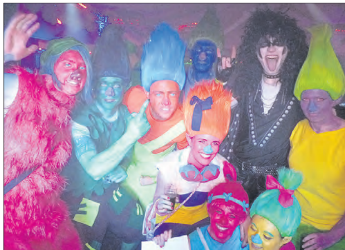
Hoch her - wie in den Vorjahren - soll es bei der Faschingsfete der SC-Tewel-Jugendinitiative in der Schützenhalle Neuenkirchen gehen.

NEUENKIRCHEN. Mit einem „Party-Doppelpack“ geht die SC-Tewel-Jugendinitiative am Samstag, dem 10. Februar, in die nächste Runde ihrer Kultveranstaltung. Die Faschingsfete in der Schützenhalle Neuenkirchen gibt es nämlich gleich für zwei Generationen: Bevor am Abend ab 21 Uhr die „älteren Narren“ zum Feiern kommen, haben am Nachmittag von 15 bis 18 Uhr die „Nachwuchs-Jecken“ das Sagen.