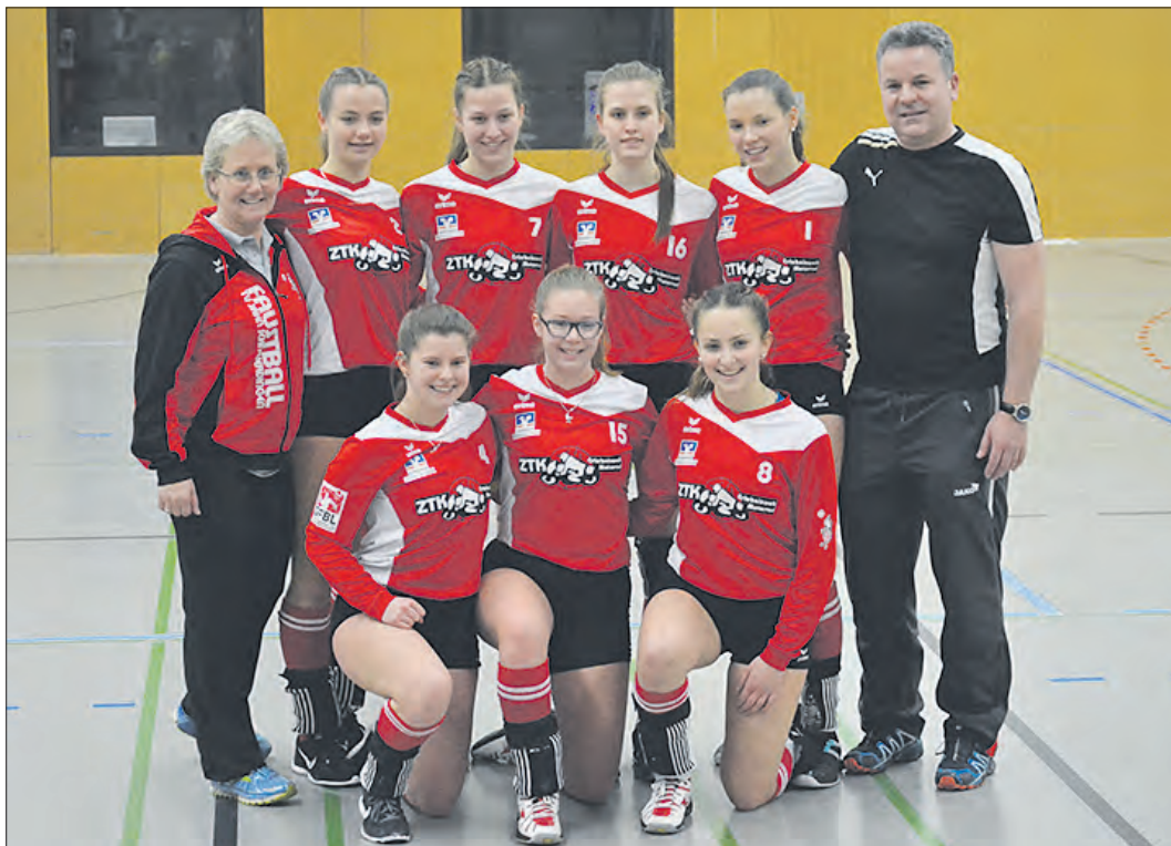
Auch die U18-Faustbatterinnen vom TV Jahn Schneverdingen jubelten über den Titelgewinn, nachdem die U16-Faustbatterinnen vorgelegt hatten.