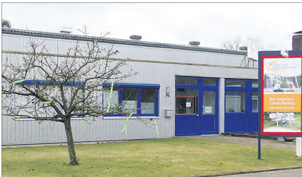
Am kommenden Samstag lädt der Verein Calluna in seine Räume, Almhöhe 12 - 14, zum Kennenlernen ein.

Tag der Kinderhospizarbeit: „Calluna“ lädt Samstag ein