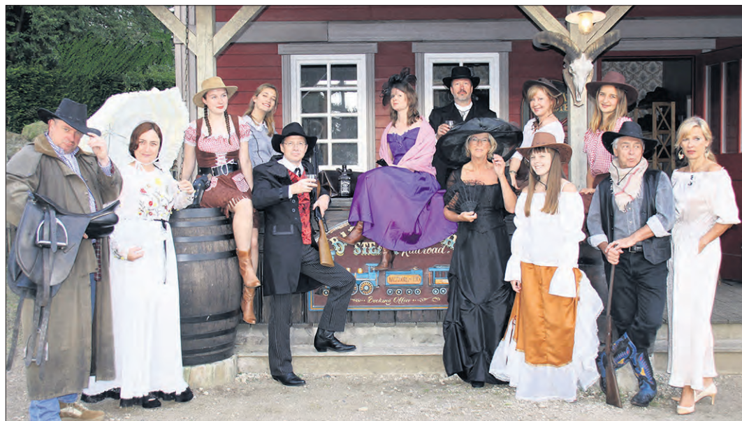
„Der Wilde Westen“ soll wieder aufleben beim diesjährigen „Schneeball“ am 20. Januar in der Alten Reithalle in Soltau. Für die Veranstaltung von Lions- und Rotary-Club verlost der Heide-Kurier zwei Freikarten.

Die Band „Tequila Sunrise“ wird in gewohnter Manier die Paare auf die Tanzfläche locken und musikalisch den passenden Rahmen schaffen. In den Tanzpausen werden die „Bombshell Saloongirls“ mit verschiedenen Einlagen von Cancan-Trioshows bis hin zum Linedance auftreten. Für das leibliche Wohl der Gäste, die natürlich auch gern stilschlecht im Western-Style oder festlich gekleidet zum „Schneeball“ können dürfen, ist ebenfalls bestens gesorgt. Und dank der Unterstützung vieler örtlicher Unternehmen gibt es wieder eine große Tombola.