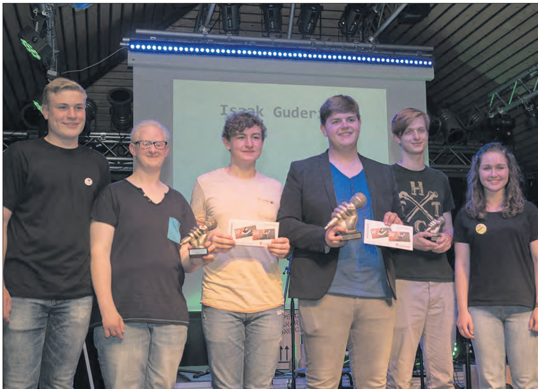
Nach dem Erfolg des ersten „Singer/Songwriter Slams“ (Foto) gibt es am 21. April eine Neuauflage.

Playback-Einspielungen oder Sequenzen sind tabu. Text und Musik des Liedes müssen selbst komponiert sein. Alle Regeln und Teilnahmebedingungen finden interessierte Musiker auf der Homepage www.sjr-schneverdingen.de oder auf der Facebook-Seite des Stadtjugendrings Schneverdingen.