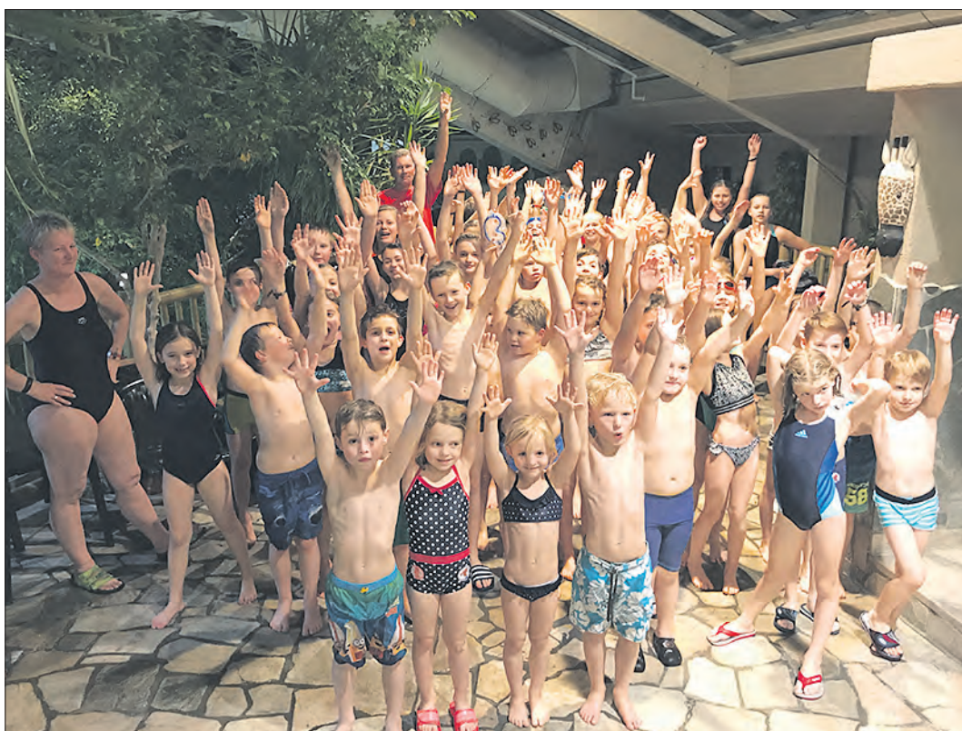
Reichlich Spaß hatten die Schwimmerinnen und Schwimmer der DLRG Munster im „Aqua Mundo“.

60 Kinder und Jugendliche der DLRG Munster im „Aqua Mundo“