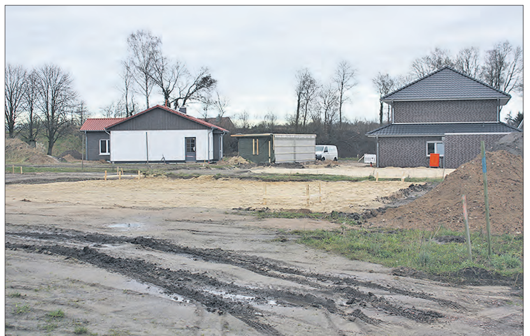
Im Soltauer Baugebiet Almaue werden derzeit die letzten Grundstücke verkauft.

Der AWS-Prokurist weiter: „Da die Nachfrage im westlichen Bereich der Stadt so gut ist, erschließen wir gerade ein neues Gebiet in der Lorenz-Wiegels-Straße. Dort wird es acht Grundstücke geben, die mit Ein-, Zwei- oder Mehrfamilienhäusern bebaut werden können. Dieser Bebauung entspricht auch die jeweilige Grundstücksgröße, die sich zwischen 525 und 1.349 Quadratmetern bewegt. Die Erschließungsarbeiten haben bereits im November begon-