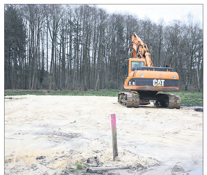
Im Bereich „Wohngebiet östlich der Moorstraße“ sind die Erschließungsarbeiten ange laufen.