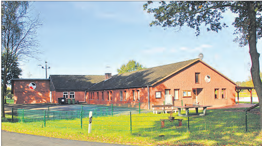
50jähriges Bestehen feiert die SG Wintermoor 68: Das große Jubiläumsfest steigt am 17. Juni.

Beim darauffolgenden entscheidenden Match gegen die TVV Neu Wulmatorf gingen die Faßberger mit 1:0 in Führung. Die TVV Neu Wulmatorf kam nochmal zum 1:1 heran. Bis zur letzten Minuten hielten die ASVler das Ergebnis, doch dann fiel der entscheidende Gegentor - „trotzdem eine hervorragende Leistung der Mannschaft“, so der Trainer.