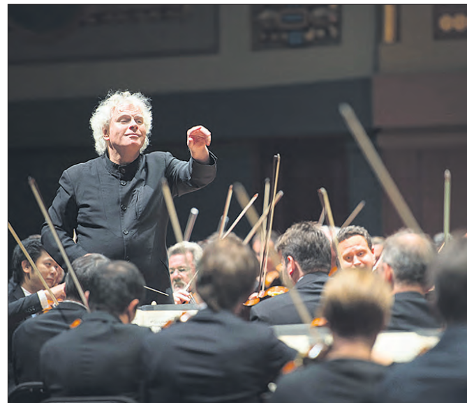
Dirigent Sir Simon Rattle feiert mit Mahlers Sechster seinen Abschied von den Berliner Philharmonikern. Das Konzert ist am 20. Juni „live“ im Dersa-Kino Soltau zu sehen.