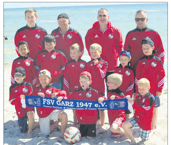
Der Ausflug der U8-Fußballer der SG Wintermoor führte die jungen Kicker und Eltern nach Rügen.

WINTERMOOR. Die Fußballkinder der U8 der SG Wintermoor verbrachten kürzlich bei einem Ausflug einige Tage auf Rügen: In einem Sporthotel in Samtens erlebten insgesamt 31 Eltern und Kinder gemeinsam eine abwechslungsreiche Zeit.