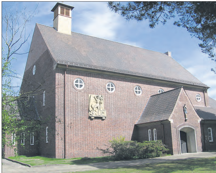
Die mit einem Hakenkreuz versehene Glocke der Michaelkirche in Faßberg sorgt weiter für Gesprächsstoff. Am kommenden Freitag, dem 8. Juni, gibt es eine Bürgerversammlung im Soldatenheim „Oase“ zum Thema „Die Entstehung Faßbergs und der heutige Umgang damit“.