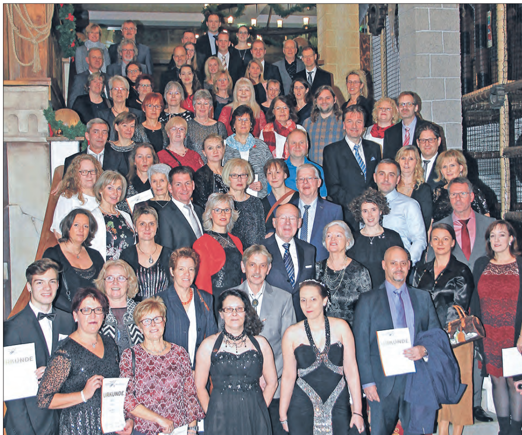
Die erfolgreichen Tänzerinnen und Tänzer nach der Verleihung der DTSA-Urkunden.