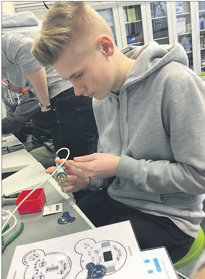
Beim Workshop in Zukunftslabor der Hochschule Hannover konnten die Schülerinnen und Schüler aus Munster selbst Hand anlegen.

Neben dem allgemeinen Wissenstransfer zeigten sich die Schülerinnen und Schüler vor allem von den möglichen Perspektiven beeindruckt, die das Thema Bildung für jeden bereithält. So war es schließlich die Biographie des Workshop-