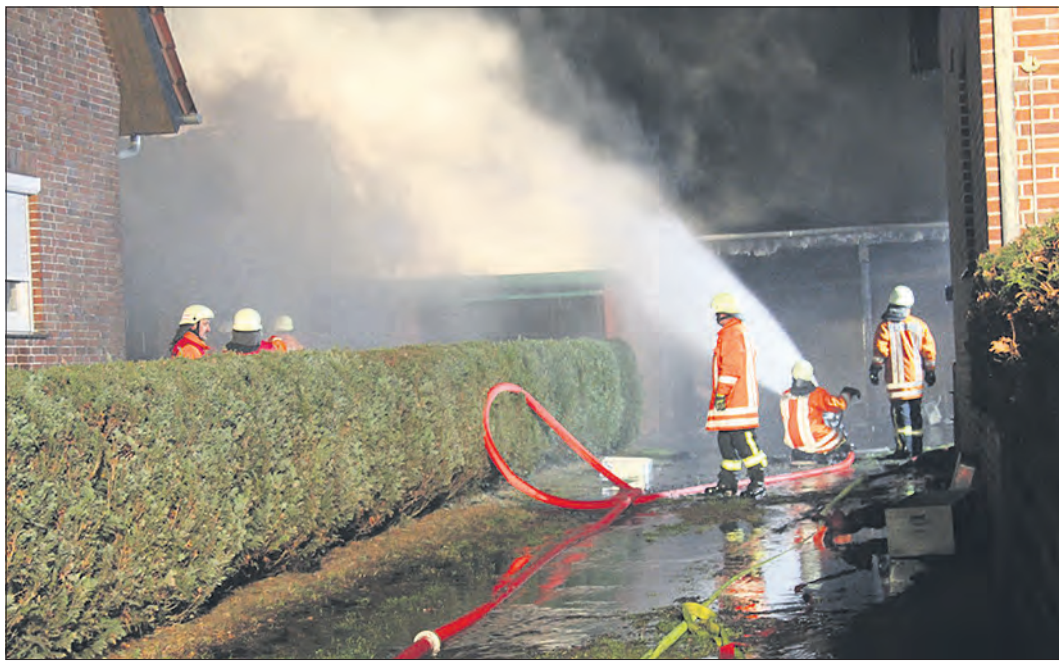
Größter Einsatz in der Silvesternacht war ein Brand in Brochdorf (Foto).

Auch in Rethem kam es gegen 11.35 Uhr zu einem Einsatz für die Feuerwehr. Im Ortsteil Stöcken hatte sich anhaftender Ruß in einem Schornstein entzündet. Die Einsatzkräfte kontrollierten den Kaminzug mit Hilfe der Wärmebildkamera. Das Feuer erlosch von allein.