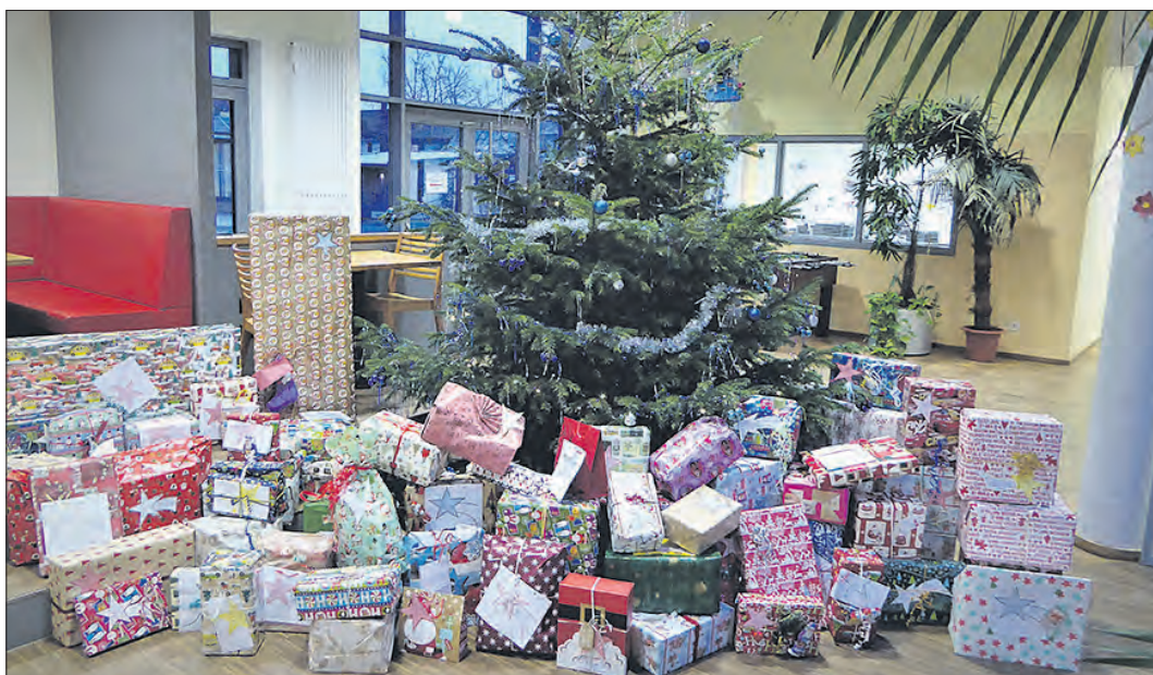
Auch diesmal war die Munsteraner Aktion „Zauberwunschaubaum 2018“ wieder ein großer Erfolg.

Munster: „Wunschzauberbaum 2018“ großer Erfolg