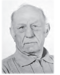
Hannover, im Januar 2019

Das Schönste, was ein Mensch hinterlassen kann, ist ein Lächeln im Gesicht derjenigen, die an ihm denken.