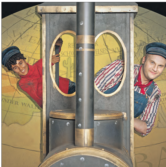
Jim Knopf und Lokomotivführer Lukas kommen am 13. Januar nach Soltau.

SOLTAU. Die Geschichte von Jim Knopf, Lukas, dem Lokomotivführer und den sympathischen Bewohnern der Insel mit zwei Bergen - genannt „Lummerland“ - des bekannten Schriftstellers Michael Ende ist ein Klassiker. In einer neuen Version erzählt das Theater Lichtermeer die aufregenden Geschichten als Musical. Am 13. Januar tritt das Ensemble im Gymnasium Soltau auf. Der Vorhang hebt sich um 15 Uhr, die etwa 90 Minuten dauernde Aufführung ist empfohlen für Erwachsene und Kinder ab fünf Jahren.