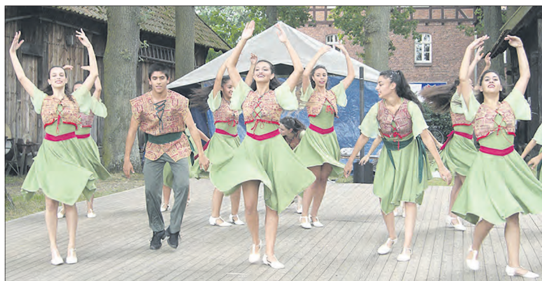
Die israelische Tanzgruppe „Hora Aviv Pardess Hanna Karkur“ kommt wieder nach Hermannsburg und tritt am 12. August auf dem Museumsgelände auf.