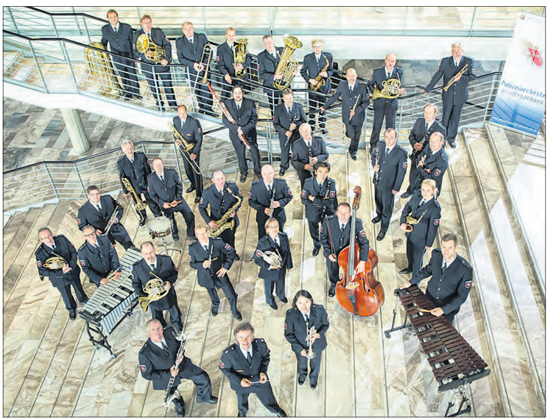
Gibt am 17. August ein Konzert in Schneverdingen: das Polizeiiorchester Niedersachsen.

Am 17. August Konzert im Schneverdingener „Funhouse“