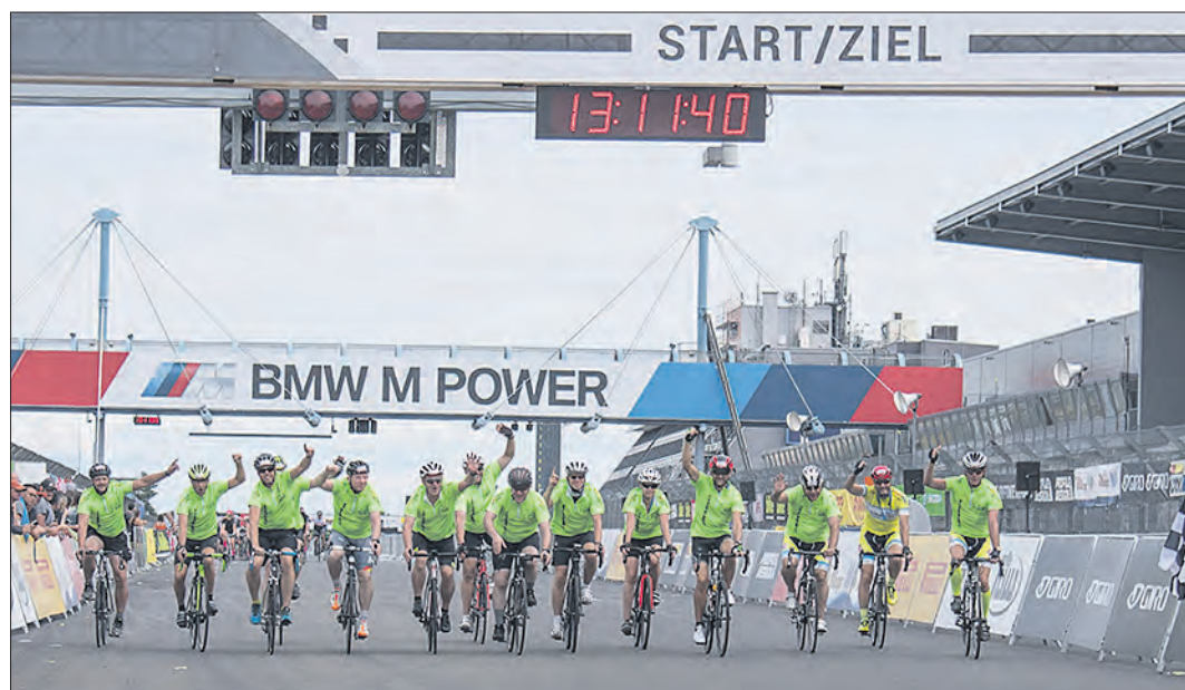
Im einheitlichen Outfit radelten die Heidekreiser zum gemeinsamen Zielfoto über die Ziellinie.

Für die Heidekreiser steht fest: „Nach dem Rennen ist vor dem Rennen.“ Und so werden schon die Planungen für die Teilnahme am Rennen im kommenden Jahr beginnen. Wer sich für den Triathlon- oder Rennrad-sport interessiert, kann sich unter www.tbegemann.de/triathlon-heidekreis informieren. Die Radsportgruppe OCS trifft sich mittwochs 18 Uhr im Soltauer Hagen am Heiratsbrunnen zum Training.