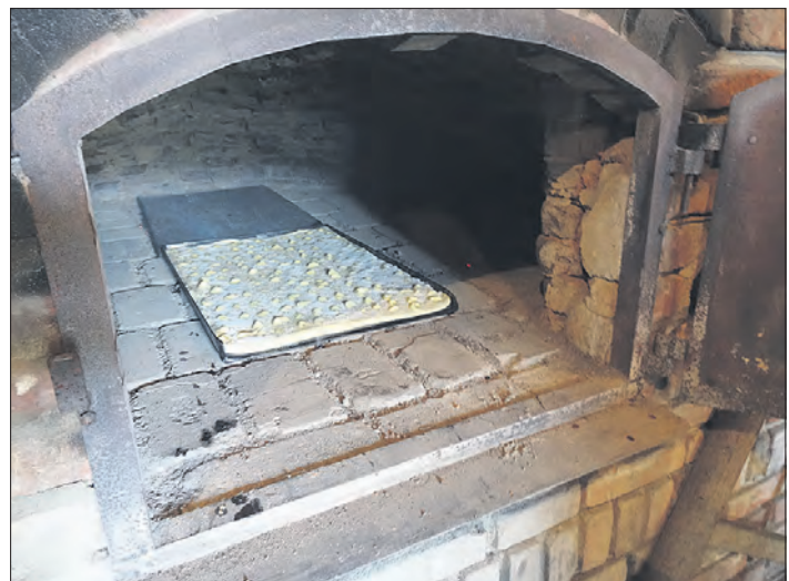
Leckerer Butterkuchen aus dem Steinbackofen und Unterhaltung warten in Lünzen auf die Besucher.

LÜNZEN. Nicht nur Leckermäuler, aber die vor allem dürfen sich auf kommenden Sonntag, den 12. August, freuen. Dann nämlich steht in Lünzen am Heimathaus wieder der Butterkuchentag auf dem Programm, zu dem der Heimatverein Lünzen einlädt. Der Startschuß für die traditionelle Veranstaltung fällt um 14 Uhr, wenn die Pröddelsband aus Jeddingen für den musikalischen Auftakt sorgt. Im Anschluß beginnt der Verkauf verschiedener Butterkuchenvarianten, darunter auch aus Buchweizen, sowie von Broten und Stuten.