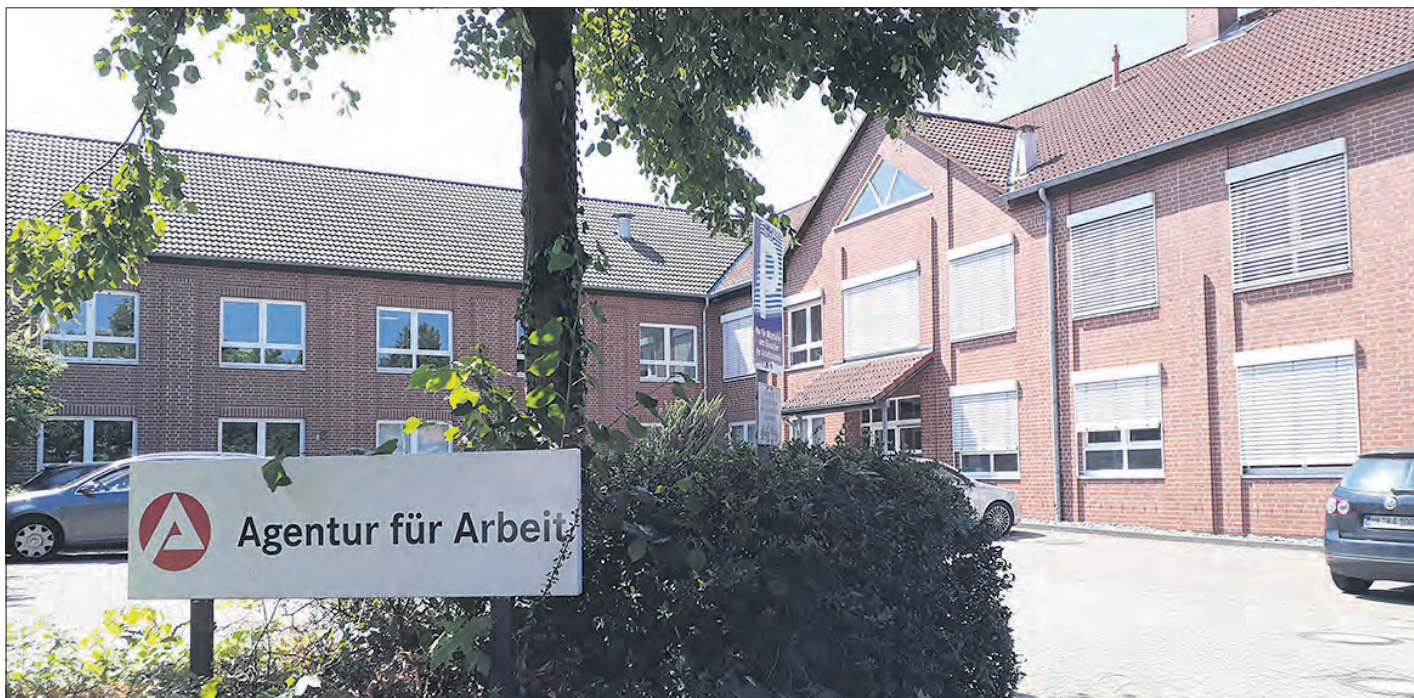
Saisonalbedingt verzeichnete die Agentur für Arbeit einen Anstieg der Arbeitslosenzahlen.

Agentur für Arbeit: Saisonal bedingter Anstieg der Zahlen