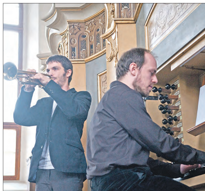
Das Duo Zia gastiert am kommenden Freitag in Bispingen.

Den beiden Musikern ist daran gelegen, ihre verschiedenen musikalischen Hintergründe so zu kombinieren, daß kein Genre dem anderen etwas wegnimmt, sondern sich alles zu einem eigenen Klang ergängt. Damit nehmen sie die Zuhörer auch in Bispingen mit auf eine geistlich-musikalische Reise zwischen indianischen Melodien, afrikanischen Rhythmen, europäischen Volksweisen und Jazz.