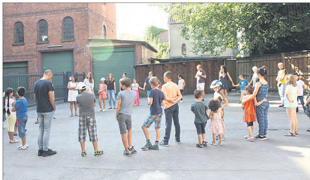
Mit einem Begrüßungskreis starteten die Kinder des Feriensprachcamps in den Tag.