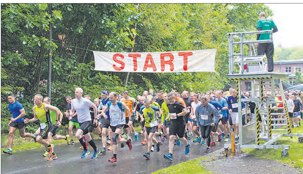
Am 11. September fällt in Faßberg der Startschuß zum nunmehr 61. Fliegerhorstrundlauf.

Sportveranstaltung in Faßberg: Anmeldungen