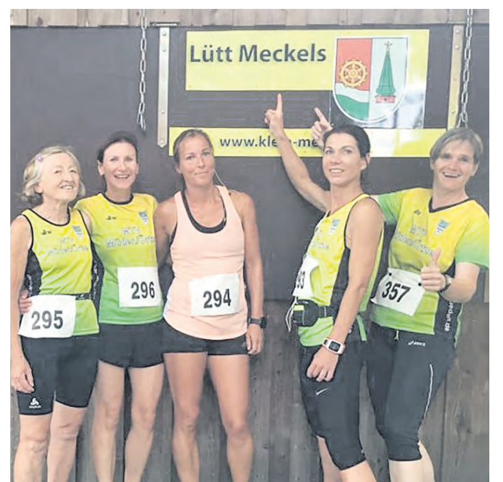
Fünf Läuferinnen vom MTV Müden vertraten ihren Verein beim Wiesenlauf in Klein Meckelsen.

Beste Voraussetzungen für einen angenehmen Laufabend. Als dann auch noch ein Geburtstagsjubiläum sein „Kamel“ für einen Schnappschuß zur Verfügung stellte, war die übliche Aufregung vor dem Start fast vergessen. Behände kletterten die Damen auf den am Straßenrand geparkten Treckeranhänger und genossen das Geschehen. Die MTV-Frauen gratulierten dem 40jährigen und vereinbarten mit dem „Geburts-tagskind“ ein Treffen mit Kaltgetränken nach dem Lauf. „Die Gast-