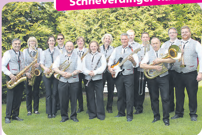
Den typischen „Heide-Abend“ bei der kommenden „Musik am Mittwoch“ begleitet das Bläserorchester Jesteburg mit zünftigen Klängen.

Bereits um 18 Uhr beginnt der Abend schwungvoll: Der Musikzug