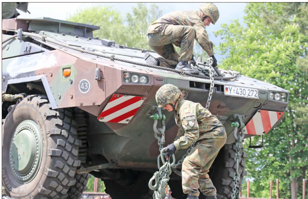
Die Soldaten beim Anlegen der Transportsicherung am gepanzerten Transportfahrzeug Boxer.

Die Alarmierung ist inzwischen abgeschlossen, aktuell läuft die Aufmarschübung, die am 12. Juni in eine „Fähigkeitsdemonstration“ mündet. „Der Rückmarsch in die Heimatstandorte bildet den Übungsabschluss“, so Blüggel. „Die Panzerlehrbrigade 9, die den deutschen Anteil, den Kern und die Führung der VJTF (L) stellt, befindet sich seit dem 1. Januar im höchsten Bereitschaftsgrad. Bei Alarmierung muß sie in zwei bis fünf Tagen für einen Einsatz zur Bündnisverteidigung abmarschbereit sein.“