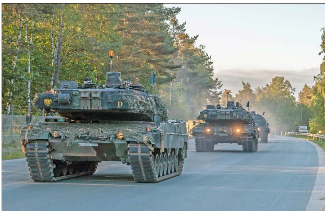
Die gepanzerten Fahrzeuge in Munster auf dem Weg aus der Kaserne zum Verladebahnhof.