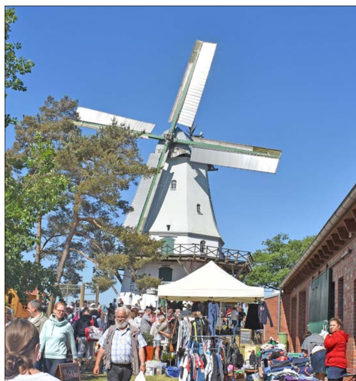
Volles Haus herrschte im vergangenen Jahr auf dem Flohmarkt an der Sprengeler Mühle.