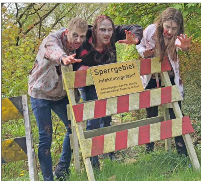
Einen Wettlauf gegen die Zeit in einer Sperrzone voller Untoter - das erleben Teilnehmer beim „Zombie Escape“ im Park.

SOLTAU. „Escape Rooms“ und „Zombie Runs“ - sogenannte „Reallife-Games“ - sind beliebt. Eine Mischung dieser beiden Varianten steht jetzt im Heide-Park Soltau auf dem Programm: Der „Zombie Escape“ mit Horror-Charakter läßt Gäste rennen und Rätsel lösen. Die erste Chance dazu haben Interessierte am kommenden Samstag.