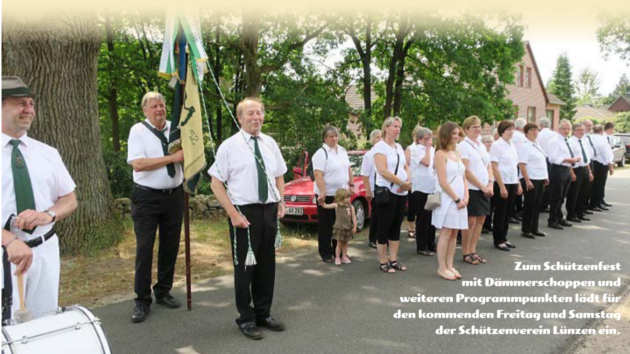
Zum Schützenfest mit Dämmerchoppen und weiteren Programmpunkten lädt für den kommenden Freitag und Samstag der Schützenverein Lünzen ein.

29640 Schneverdingen OT Lünzen · Lünzener Straße 2a ☎ (0 51 93) 22 33 · Fax (0 51 93) 37 74