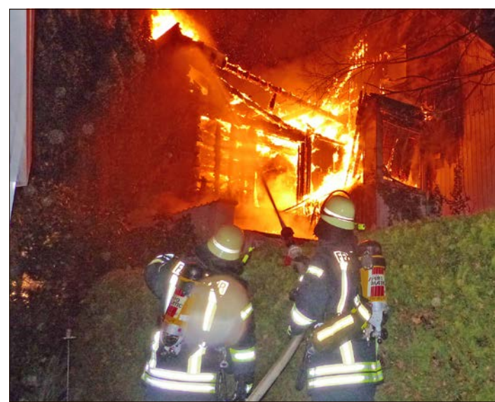
Auch im Heidekreis: Die Bürger können sich auf die motivierten Ehrenamtlichen der Freiwilligen Feuerwehren verlassen.