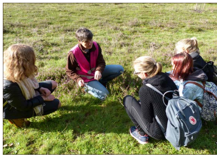
„Klassenziel Naturpark“: Der Naturpark Lüneburger Heide bietet wieder Unterstützung für Klassenreisen an.

Der Umwelt- und Nachhaltigkeitswissenschaftler arbeitet seit nunmehr zweieinhalb Jahren als Koordinator für den Bereich Bildung für nachhaltige Entwicklung (BNE) in der Geschäftsstelle des Naturparks Lüneburger Heide. In einem Arbeitskreis finden sich in regelmäßigen