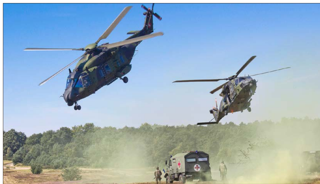
Auch Hubschrauber des Transporthubschrauberregiments 10 „Lüneburger Heide“ werden beim Tag der Bundeswehr in Faßberg zu sehen sein.

Wegen des erwarteten Andrangs bitten die Veranstalter die Besucher, die ausgewiesenen Parkplätze anzufahren und von dort aus die kostenlosen Shuttlebusse zu nutzen. Dieser Service wird von 8 bis etwa 19 Uhr angeboten. Eine Zufahrt zum Fliegerhorst Faßberg wird nicht möglich sein, weder mit dem Pkw noch mit einem Fahrrad. Auch Fußgänger werden nicht durchgelassen. Neben herkömmlichen Bussen werden auch Niederflerbusse eingesetzt, um Men-