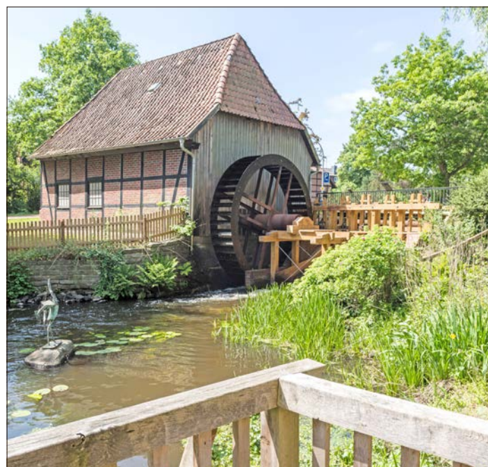
Die Wassermühle in Munster öffnet zum Deutschen Mühlentag die Pforten.

Der Eintritt ist an beiden Veranstaltungstagen frei, und für die Kinder wird zum Schützenfest etwas zum Spielen aufgebaut.