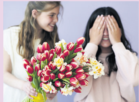
Tulpen zählen zu den Lieblingsblumen der Deutschen. Über einen bunten Strauß freut sich jede Mutter.

Anthurien stammen ursprünglich aus den tropischen Regionen Amerikas, wo mehrere hundert Arten zu finden sind. Forschungsreisende brachten die Gewächse bereits im 19. Jahrhundert nach Europa. Schon bald entstanden hier die ersten Kreuzungen und der Siegeszug der Anthurie in den Wohnzimmern begann. Heute hat man die Wahl: Verschenkt man die exotischen Schönheiten als Topfpflanze oder als Schnittblume im Strauß? In der Vase haben Anthurien eine extreme Ausdauer und halten tatsächlich bis zu drei Wochen. Noch längere Freude bringen die Schönheiten im Topf. Anders als ihr exotisches Äußeres vermuten lässt, sind diese relativ anspruchslos und blühen zuverlässig immer wieder. Übrigens: Bei den Pflanzen ziehen nicht die Blüten, sondern die farbig, oft glänzenden Hochblätter alle Blicke auf sich. Bei vielen Sorten haben diese eine Herzform, weshalb sie sich besonders gut als Geschenk für einen geliebten Menschen eignen. Das Farbspektrum reicht von zarten Tönen wie Creme und Violett über Schokobraun und Hellgrün bis hin zu knalligem Rot oder Pink. Da ist garantiert auch die Lieblingsfarbe der Mama dabei.