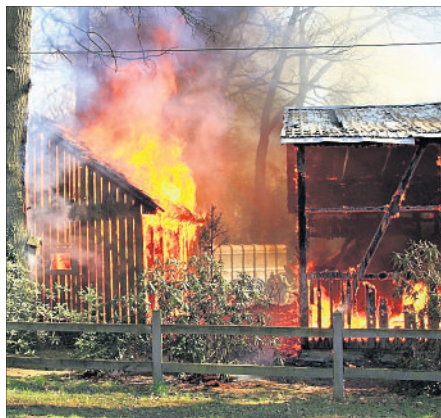
Rund 200 Feuerwehrleute kämpften beim Großbrand in Lünzenbrockhof gegen die Flammen.

„Brandermittler des Zentralen Kriminaldienstes der Polizeiinspektion Heidekreis waren am Sonntag, Montag und Dienstag am Brandort und führten Untersuchungen durch, bei denen sie von einem Sachverständigen des Landeskriminalamtes unterstützt wurden“, so Polizeisprecher Olaf Rothardt. Bei den Untersuchungen seien auch ein Brandstoffpühhund und Kriminaltechniker im Einsatz gewesen, zudem hätten die Experten auch eine Drohne aufsteigen lassen. „Nach Auswertung aller Erkenntnisse gehen die Ermittler von Brandstiftung aus“, berichtet Rothardt.