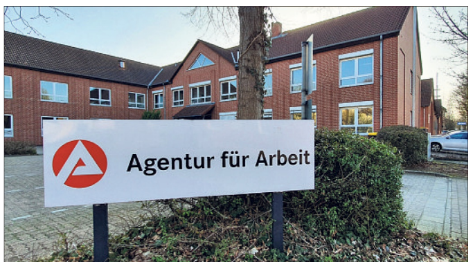
Die Agentur für Arbeit in Soltau.

Auch auf den Bereich Unterbeschäftigung geht die Agentur für Arbeit in ihrer Mitteilung ein: „Dazu zählen zusätzlich zu den Arbeitslosen solche Personen, die nicht als arbeitslos gelten, die aber beispielsweise im Rahmen von arbeitsmarktpolitischen Maßnahmen gefördert werden. Die Unterbeschäftigung im Landkreis Celle betraf nach vorläufigen Angaben im April 7.907 Personen und im Heidekreis 5.907 Personen.“