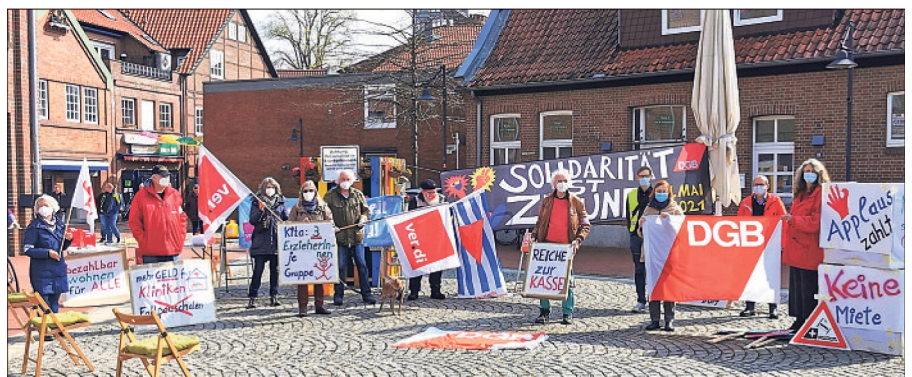
Die Organisatorinnen und Organisatoren des DGB bei der Veranstaltung zum 1. Mai in Soltauer Hagen.

Im Anschluss an die Beiträge der Hauptredner gab Braun Interessierten noch die Möglichkeit, sich am „offenen Mikrofon“ zu äußern - eine Chance, die viele an diesem 1. Mai nutzten.