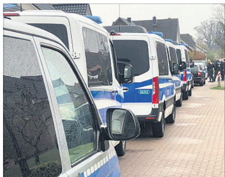
Erneut drehte sich das „Räderwerk“. Rund 150 Einsatzkräfte durchsuchten am vergangenen Donnerstag mehrere Geschäftshäuser und private Wohnunterkünfte.

HEIDEKREIS. Es drehte sich erneut, das „Räderwerk“, mehrere Zahnräder griffen ineinander: Am vergangenen Donnerstag, dem 29. April, kontrollierten Kräfte des Projekts verschiedenster Behörden und Entscheidungsträger mehrere Geschäftshäuser und Privatunterkünfte im Heidekreis sowie in Bremen, Verden und Hannover. „Etwa 150 Einsatzkräfte von Polizei und Finanzbehörde durchsuchten ab 9 Uhr in einem Wirtschaftsverfahren die Räumlichkeiten einer Clanfamilie“, so ein Polizeisprecher.