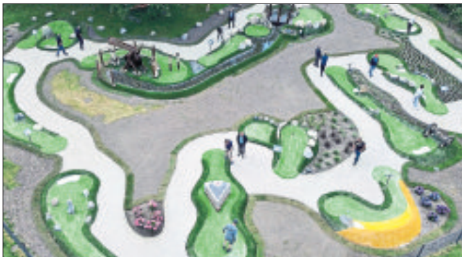
Ein Teil der neuen „Adventure Schnuckengolf“-Anlage aus der Vogelperspektive.

„Ich weiß, dass sich viele auf diese Anlage freuen“, sagte Bürgermeisterin Meike Moog-Steffens. Bevor sie selbst zum Minigolfschläger griff, um die verschiedenen Herausforderungen in Angriff zu nehmen, ließ sie im Schatten der großen Bäume auf dem Gelände die Vorgeschichte kurz Revue passieren. Im Gesamtkonzept für den Walter-Peters-Park sei vorgese-