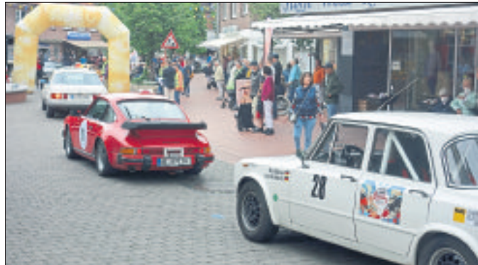
Gleich am Startpunkt in der Marktstraße in Soltau gab es eine kleine Zeitprüfung.

Übrigens: Eine Bildergalerie zur „Heide-Classic“ in der Böhme-stadt finden Interessierte im Internet unter www.heide-kurier.de .