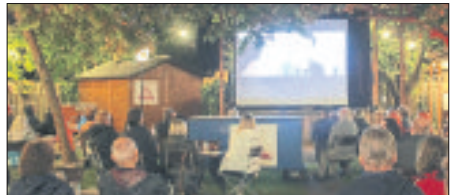
Im Biergarten am Rathaus kann das Schneverdingener Publikum auch in diesem Sommer wieder Open-Air-Kino genießen.

SCHNEVERDINGEN. Auch im August präsentiert der Schneverdingener Verein „Lichtspiel“ ein wöchentliches Programm immer samstags ab 19 Uhr im Biergarten am Rathaus der Heideblütenstadt. Auf Live-Musik und Open-air-Kino können sich Besucher am kommenden Samstag freuen: Am 7. August stehen ab 20 Uhr „Lena und Jürgen“ auf der Bühne, bevor gegen 21.30 Uhr der Film „Die Känguru Chroniken“ startet. Einlass ist ab 18.30 Uhr. Besucher müssen auf Regeln gemäß der Niedersächsischen Verordnung über infektionsschützende Maßnahmen gegen die Ausbreitung des Coronavirus beachten. Karten gibt es im Vorverkauf freitags an der „Lichtspiel“-Kinokasse, Oststraße 31, und online unter www.lichtspiel-schneverdingen.de . Die Abendkasse öffnet immer eine Stunde vor Einlass-Beginn in den Biergarten.