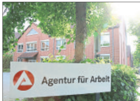
Die Agentur für Arbeit in Soltau.

Auch auf den Bereich Unterbeschäftigung geht die Agentur für Arbeit in ihrer Mitteilung ein: „Die Unterbeschäftigung im Landkreis Celle betraf nach vorläufigen Angaben im Juli 7.443 Personen und im Heidekreis 5.603 Personen.“