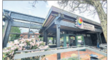
Bundstagsabgeordneter Lars Klingbeil überbrachte die frohe Botschaft: Mit 14.000 Euro fördert der Bund die Bibliothek Waldmühle.

SOLTAU. Gute Nachrichten für Soltau und die gesamte Region: Die Bibliothek Waldmühle in Soltau bekommt 14.000 Euro vom Bund für ihr Projekt „Auf ins Rampenlicht“. Das berichtet der heimische Bundstagsabgeordnete Lars Klingbeil. Mit dem Projekt werde ein multifunktionaler Jugendbereich inmitten der Waldmühle, also ein Jugendraum mit Tablets und weiterer Technik, realisiert. „Ich freue mich sehr, dass der Bund die Bibliothek Waldmühle in Soltau unterstützt. Immer wieder setze ich mich dafür ein, dass wir die Kultur bei uns auf dem Land stärken und diese Förderung durch den Bund ist ein erneutes Zeichen dafür, dass unsere Region weiter vorankommt“, macht Klingbeil deutlich. Gerade die Corona-Pandemie habe noch einmal deutlich gezeigt, wie wichtig Kultur sei und für Klingbeil ist ganz klar: „Wir brauchen auch in ländlichen Regionen wie in unserer