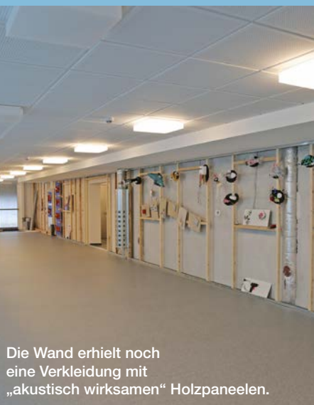
Die Wand erhielt noch eine Verkleidung mit „akustisch wirksamen“ Holzpaneelen.