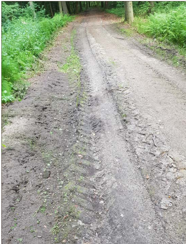
Im Herbst soll der Weg hergerichtet sein.

Daß es bei diesen Baumfällungen und dem Transport der Stämme ohne Beschädigung des Weges wohl kaum hätte abgehen können, liegt auf der Hand und regt auch nieman-