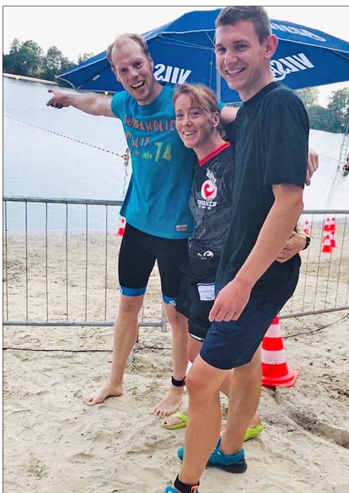
Zeigten sich von der Organisation des Swb-Silbersee-Triathlons begeistert: die Heidekreis-Triathleten.

Nach der ferienbedingten Wettkampfpause stehen dann von Mitte August bis Anfang Oktober noch einige Termine an, unter anderem auch die Landestitelkämpfe der U16 und U20 am 31. August und 1. September in Braunschweig. Auch die Einzelkreismeisterschaften der U10 bis U16 in Munster und ein Rundenwettkampf am 11. September in Schneverdingen und das „Fest der 1.000 Zwerge beim HSV“ Ende September bieten noch einige Startmöglichkeiten, um das extrem erfolgreiche Jahr für die Schneverdingen Leichtathleten positiv abzuschließen.