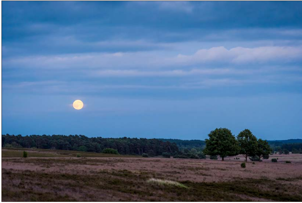
Eine Vollmondwanderung durch die Heide ist ein besonderes Erlebnis.

Besondere Touren auf dem Heidschnuckenweg