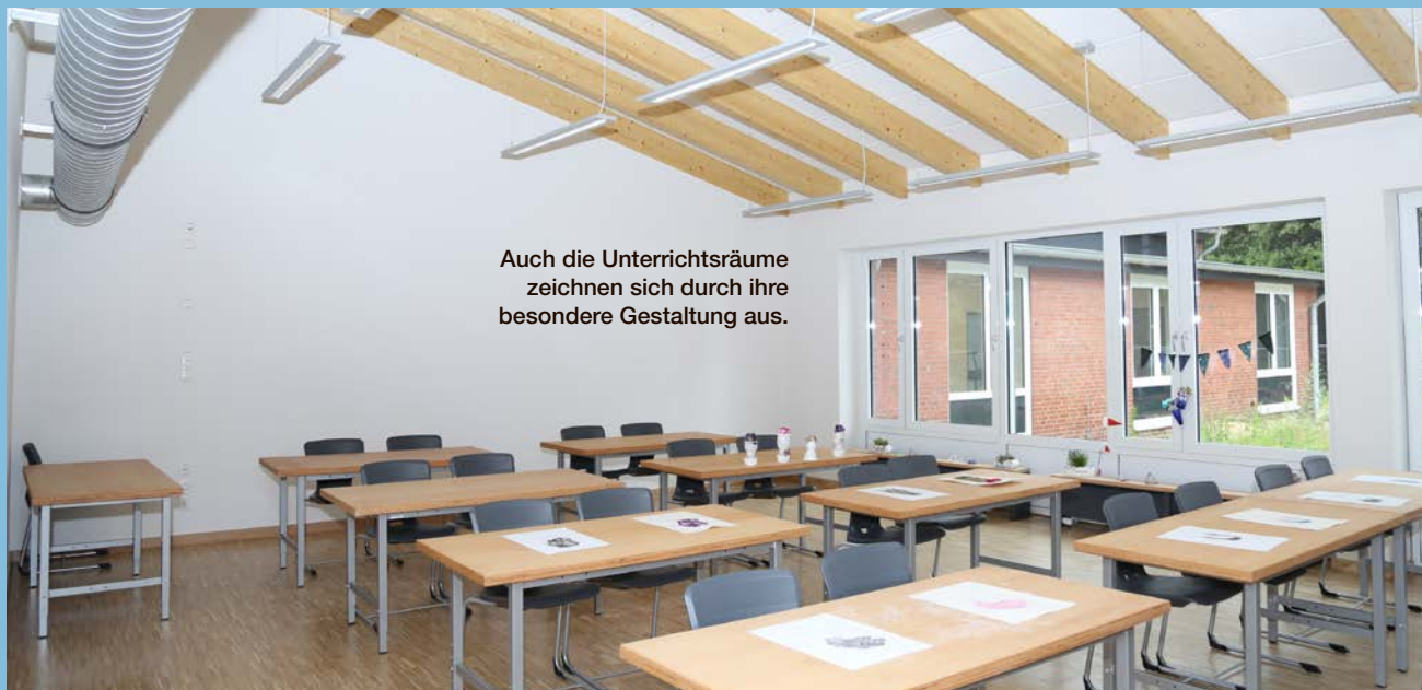
Auch die Unterrichtsräume zeichnen sich durch ihre besondere Gestaltung aus.