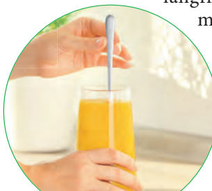
Kijimea Regularis hilft bei träger Verdauung und einem Blähbauch – einfach einrühren und trinken

Die Anwendung von Kijimea Regularis im Alltag ist kinderleicht. Nach Bedarf zwei- bis dreimal täglich einen Löffel des einzigartigen Granulats in ein Glas Wasser einrühren und trinken. Die Wirkung setzt bereits 12 bis 72 Stunden nach der Einnahme ein. Das Geniale: Kijimea Regularis wirkt rein physikalisch: Der Darm wird von innen heraus, wie durch