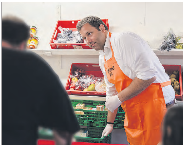
Lars Klingbeil packte bei der Lebensmittelausgabe mit an.