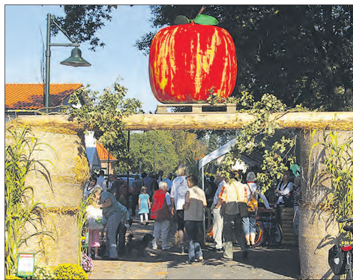
Am kommenden Sonntag lockt wieder der Apfelmarkt in Lünzen.

fort, bei anderen vergleicht er die Äpfel mit Fotos. Er schneidet die Frucht auf und sieht sich das Innenleben genau an. Zwei bis drei Äpfel sollten es schon sein, um eine genaue Bestimmung zu erhalten.