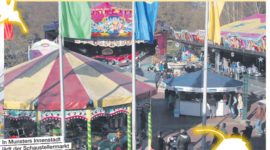
In Münsters Innenstadt lädt der Schaustellermarkt zu Karussellfahrten und anderen Attraktionen ein.

Sonntag, 7. Oktober ab 13 Uhr verkaufsoffen: