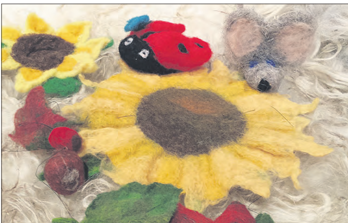
Passend zur Jahreszeit sind die Themen der beiden Oktober-Workshops in der Filzwelt gewählt.

Herbstschmuck herstellen in der Filzwelt