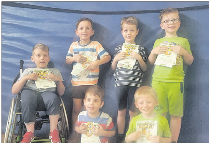
Präsentieren stolz ihre Urkunden: die Kinder der Rehasportgruppe.

SCHNEVERDINGEN. Die Kinderturngruppe und die Rehasportgruppe für Kinder des TV Jahn Schneverdingen haben vor kurzem das kleine Sportabzeichen abgelegt. Die Kinder absolvierten Übungen wie Laufen, Balancieren, Schwingen, Ziehen, Kriechen sowie Werfen mit viel Spaß und Geschick, so daß sie letztlich als Belohnung für ihren Fleiß das kleine Sportabzeichen in den Händen halten konnten. Die Kinderturngruppe trifft sich regelmäßig dienstags von 15.30 bis 16.30 Uhr,