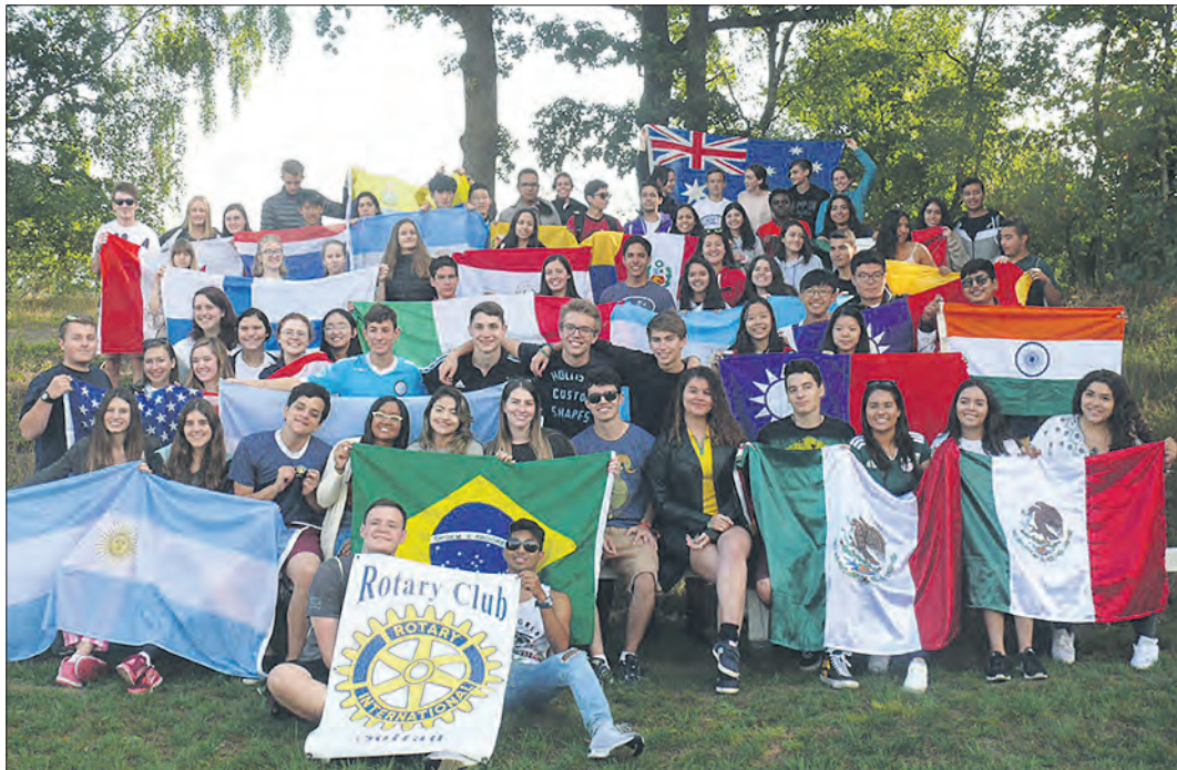
Ein erlebnisreiches Wochenende verbrachten die Austauschschüler auf Einladung der Rotary-Clubs Soltau und Walsrode.

Rotarier laden Schüler des Austauschprogramms ein