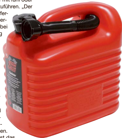
Manche Fahrer vertrauen auf den Zusatzsprit.

Am besten nutzt man dazu Spanngurte oder Befestigungsriemen“, so Leser. Für den grenzüberschreitenden Verkehr sind die jeweiligen Zoll- sowie Straßenverkehrsvorschriften zu beachten. In manchen Ländern ist das Mitführen von Reservekanistern zudem generell untersagt.