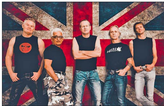
„Miron Aiden“ heißt die Tributeband, die bei der „Iron Maiden Party“ am kommenden Samstag das Soltauer Band-Center rockt.

Tributeband „Miron Aiden“ im Band-Center