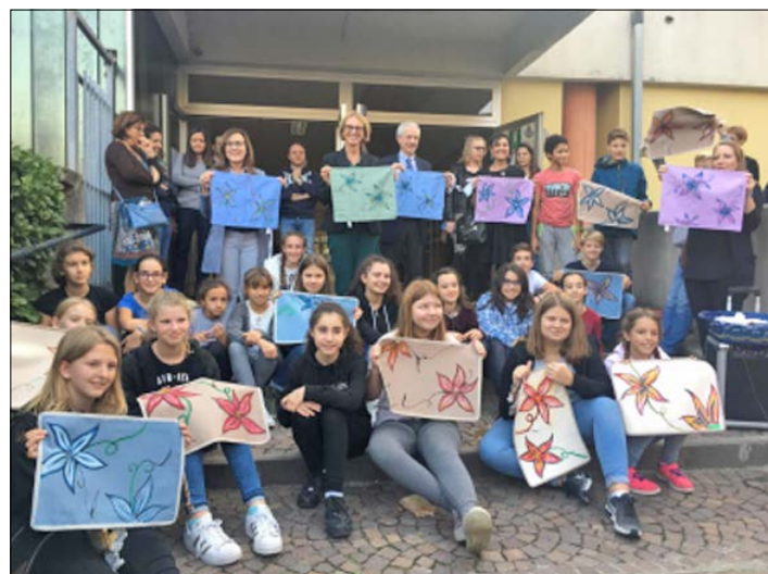
Beim Besuch in Muggio, Italien: Die Kinder präsentieren ihre gefärbten Tischsets.