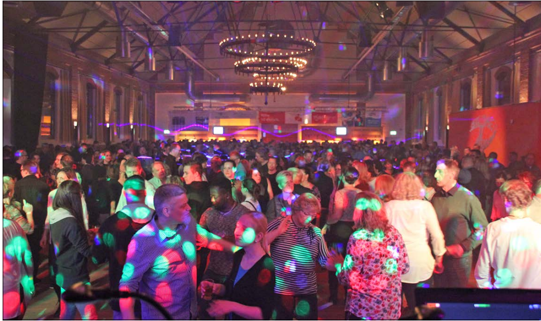
Bereits in den vergangenen zwei Jahren feierten die Gäste in der Alten Reithalle. Dort steigt am Samstag, 16. März, nun die dritte Auflage der Veranstaltung, „Die Party des Jahres 3.0“.

Alte Reithalle am 16. März: Vier DJ gehen in dritte Runde