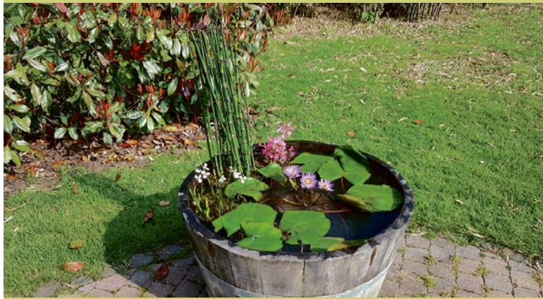
Mit einer Seerose und Begleitpflanzen wird aus einem wasserdichten Behälter ein attraktiver Miniteich.