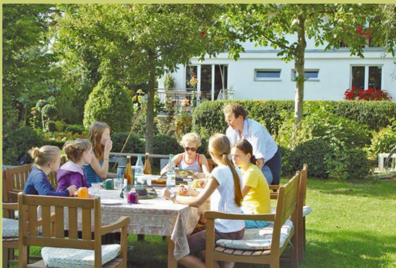
Mit Familie und Freunden das Beisammensein zu feiern, ist im eigenen Grün einfach besonders schön.

Ein schön gestalteter Garten, mit blühenden Beeten ist mehr als der Rahmen für ein gelungenes Gartenfest: Im besten Fall steht der Garten im Mittelpunkt und der Gartenbesitzer lässt seine Gäste daran teilhaben.