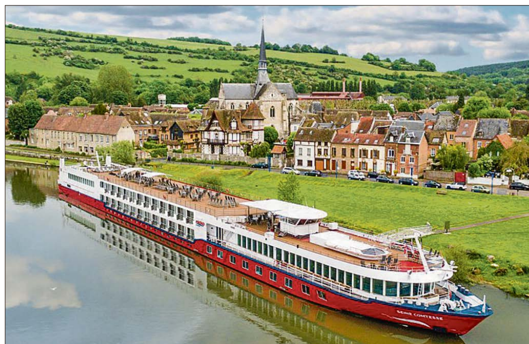
Mit der MS Seine Comtesse starten die Heidjer in Paris zu einer Flußkreuzfahrt auf der Seine.

Dort steht vormittags ein Ausflug (Ausflugspaket) nach Giverny zum Monet-Haus mit paradiesischem Garten und berühmtem Seerosenteich auf dem Programm. Zu sehen