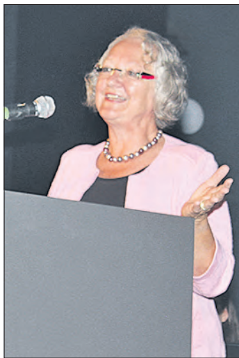
Gesine Meißner (MdEP) brach eine Lanze für Europa.