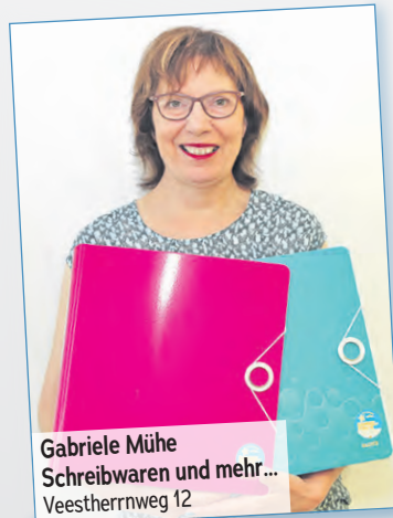
Gabriele Mühe Schreibwaren und mehr... Veestherrnweg 12