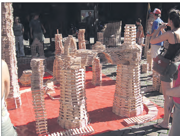
Tausende von Holzstäben verwandeln einen Straßenabschnitt in eine große Spielbaustelle.

Für Gaumenfreuden von Waffeln bis zu internationalen Leckereien sorgen neben verschiedenen Ständen die Mitglieder des Event-Teams des Bürgerhauses sowie das Mütterzentrum. Aufgrund der Veranstaltung wird der Veestherrnweg ab Höhe der Munster-Touristik bis zur Einmündung auf die Wilhelm-Bockelmann-Straße für den Straßenverkehr in beide Richtungen gesperrt. Radfahrer werden gebeten abzusteigen. Übrigens läuft in Munster am 8. September neben dem Fest der Bildung und Kultur am nahegelegenen Ollershof noch eine weitere Veranstaltung: Von 11 bis 16 Uhr lädt dort der Kultur- und Heimatverein zum der Mahl- und Backtag ein.