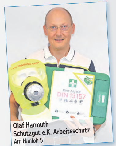
Olaf Harmuth Schutzgut e.K. Arbeitsschutz Am Hanloh 5