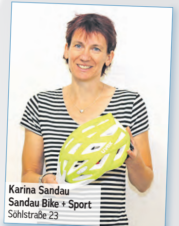
Karina Sandau Sandau Bike + Sport Söhlestraße 23