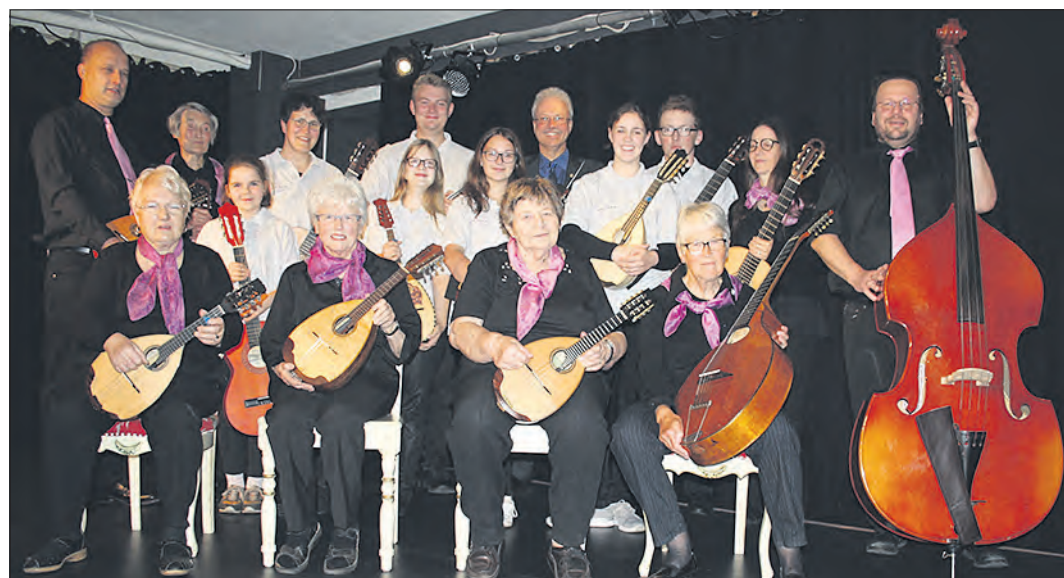
Geben am 9. September ein gemeinsames Konzert in der katholischen Kirche St. Ansgar in Schneverdingen: das Zupforchester „Saitenwind“ und die Gruppe „SaitenFreunde“.

„Saitenwind“ und „SeitenFreunde“ in St. Ansgar