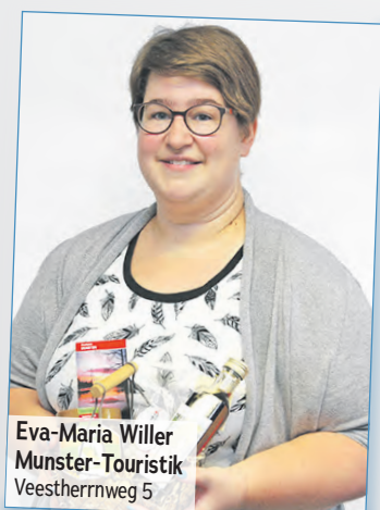
Eva-Maria Willer Munster-Touristik Veestherrnweg 5