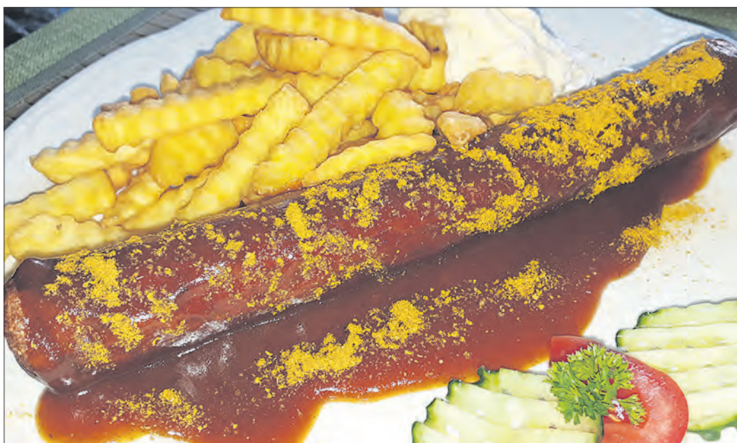
„Spezialität des Hauses“ im Soltauer Gasthaus „Zum grünen Jäger“, dem Stammlokal der Vereinigung „Soltauer Curry-Wurst a.V.“

„Da nun ein Ende der Superwurst im Voß'schen Traditionslokal abzusehen ist, wird sich die SCV nach einer neuen Stammlokalität umsehen müssen, was hinsichtlich der Würstquali-