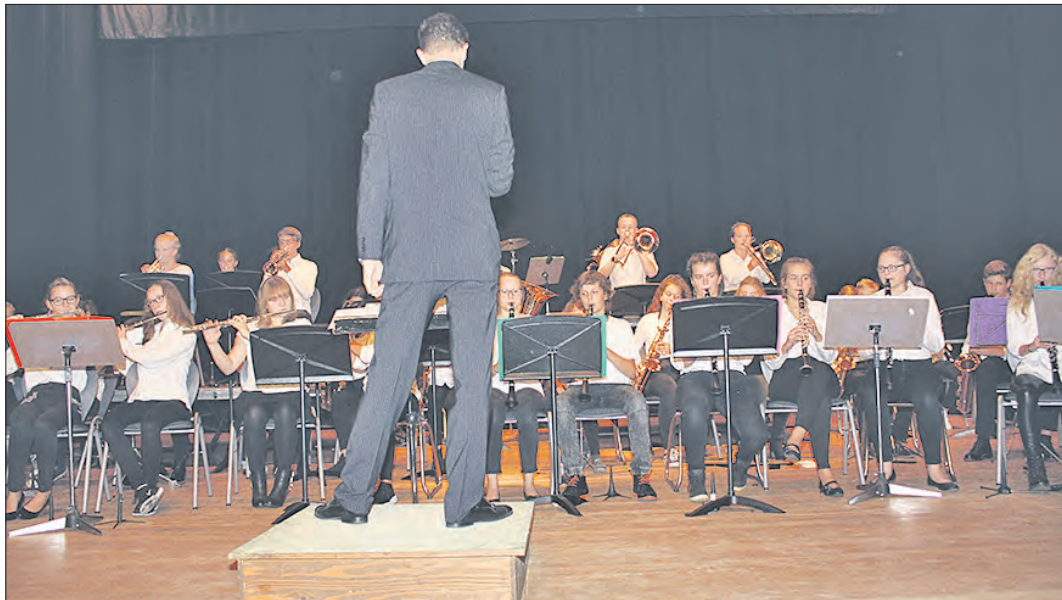
Das Symphonische Blasorchester sorgte für den musikalischen Rahmen der Feierstunde.

Nach diesem doch eher etwas feierlichen Akt ging es dann lockerer beim großen Schulfest im Gebäude und auf dem Schulhof weiter, wobei auch die Ergebnisse der vorangegangenen Projektwoche präsentiert wurden.