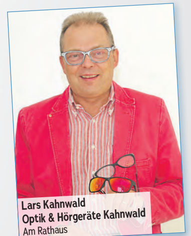
Lars Kahnwald Optik & Hörgeräte Kahnwald Am Rathaus