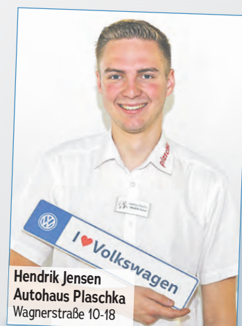
Hendrik Jensen Autohaus Plaschka Wagnerstraße 10-18