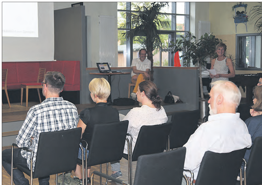
Einmal im Jahr lädt die Bürgerstiftung Munster ein und berichtet beim Stifterforum über Personalien, Finanzen und Aktivitäten.