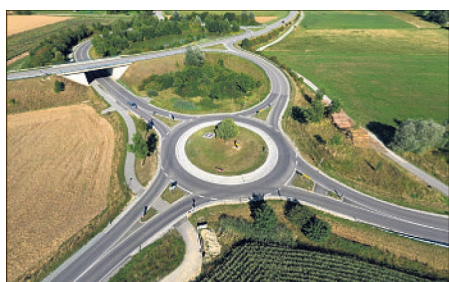
In Deutschland gibt es rund 16.000 Kreisverkehre in unterschiedlichen Varianten.