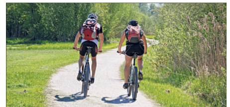
Rund um den 5. Mai stehen in diesem Jahr wieder länderübergreifende Verkehrssicherheitsaktionen mit dem Hauptaugenmerk auf Radfahrerinnen und -fahrern auf dem Plan - auch im Heidekreis.

Rohleder dabei von den jeweils örtlichen Kontaktbeamten aus Munster und Bad Fallingbostal. Nach der „Winterpause“ steigt jetzt zunehmend die Anzahl derjenigen, die sich wieder begeistert auf das Rad schwingen. Und das wiederum erhöht die Gefahr, in einen Unfall verwickelt zu werden. Ein Fahrradsturz kann zu schweren Verletzungen insbesondere im Kopfbereich führen. Ein Fahrradhelm, richtig getragen, kann hier vor folgenreicheren Verletzungen schützen oder in vielen Fällen auch Leben retten. „Darum sollte bei jeder Fahrt ein Fahrradhelm getragen werden“, rät die Polizei. Weitere Informationen zum Thema Fahrradfahren erhalten Interessierte beim Präventionsteam der Polizeiinspektion Heidekreis unter Ruf (05191) 9380109.