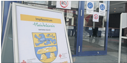
Im Impfzentrum werden die gelieferten Vakzine zeitnah verabreicht - „Insgesamt brauchen wir aber einfach mehr Impfstoff“, so Landrat Manfred Ostermann .

Verlängerung für Zentrum in Heidmarkhalle