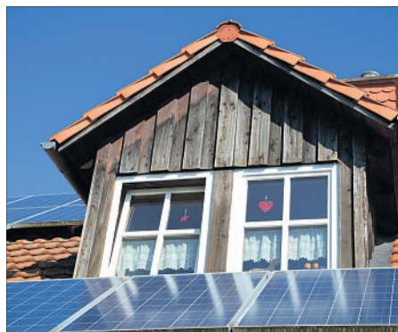
Insbesondere Photovoltaik erfreut sich einer steigenden Beliebtheit. Ein „Eignungs-Check Solar“ der Energieagentur Heidekreis zeigt, welche Möglichkeiten für eine Solarenergienutzung es gibt.

„Wir möchten unseren Hauseigentümern diese umfangreiche Beratung näherbringen“, erläutert Weinsziedler. „Sie ist eine gute Grundlage und Entscheidungshilfe bei den Überlegungen rund um den Bau einer eigenen Solaranlage“, so die Leiterin der von der Energieagentur Heidekreis. Die Beratung, für den der Hauseigentümer nur einen kleinen Teil der Kosten als Eigenanteil übernehmen müsse, erfolge hersteller-