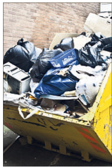
In einer aktuellen Mitteilung warnt der Landkreis Heidekreis vor illegalen Abfallsammlungen.

des Heidekreises seien in jüngerer Zeit diverse Fälle illegaler Abfallsammlungen gemeldet worden, so der Landkreis: „Zumeist handelt es sich dabei tatsächlich um Aufrufe von unrechtmäßigen Sammlern. Die Wurfzettel weisen oftmals keine konkrete Angabe zum Sammler aus oder Handynummern laufen ins Leere.