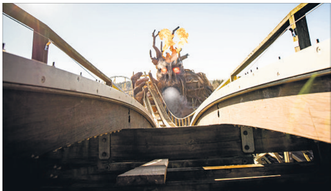
Eine der Hauptattraktionen des Heide-Parks: die Holzachterbahn Colossos.

Die 6. Kammer des Verwaltungsgerichts Lüneburg hatte mit Beschluss vom 20. April in einem Eilverfahren vorläufig festgestellt, dass die Betreiber des Heide-Parks Soltau ihren Freizeitpark unter Einhaltung eines strengen Hygienekonzepts öffnen dürfen. Die Kammer war zu der Überzeugung gelangt, dass das Öffnungsverbot die Heide-Park-Betreiber angesichts des von ihnen erarbeiteten umfassenden Hygienekonzepts in ihrem Recht unverhältnismäßig einschränke.