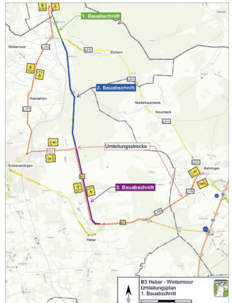
Auf der B3 beginnen am 10. Mai zwischen Heber und Wintermoor Bauarbeiten zur Erneuerung der Fahrbahn und des parallel zur Straße verlaufenden Radweges.

Der 3. Bauabschnitt beginnt an der Kreuzung B3 / K53 „Bundesstraße“ / „Alte Landesstraße“ und verläuft bis zum Kreisverkehrsplatz „Scharreler Straße“ (B3). Diese Arbeiten beginnen voraussichtlich Anfang Juli dieses Jahres und sollen bis Anfang August abgeschlossen werden. Auch hier wird unter Vollsperrung der B3 gearbeitet. Die Bundesstraße 3 ist ab der Kreuzung B3 / K53 „Bundesstraße“ / „Alte Landesstraße“ bis zum Kreisverkehr in Richtung Heber während der Bauarbeiten nicht befahrbar. Die Umleitung wird, so der Behörden-