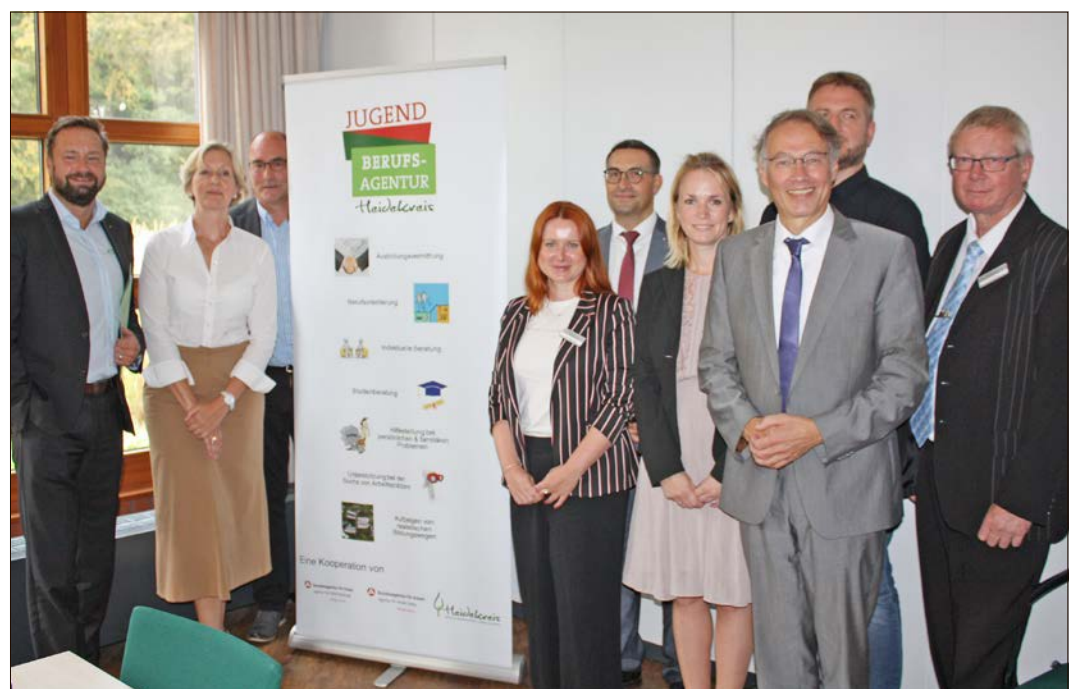
Vertreterinnen und Vertreter von Landkreis, Agentur für Arbeit und Berufsbildenden Schulen stellten die neue Jugendberufsagentur vor.

Und genau deshalb kooperieren in der JBA Jobcenter, Agentur für Arbeit und Jugendberufshilfe unter dem Motto „Gemeinsam mehr erreichen“. Diese Einrichtungen sind bei den JBA-Terminen dann mit je einer Fachkraft vertreten und ersparen den jungen Leuten unter Umständen den wiederholten Gang zu verschiedenen Behörden. Entsprechend groß ist das Spektrum, das Ausbildungsvermittlung, Berufsorientierung, indi-