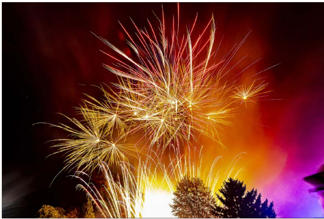
Um etwa 22.30 Uhr steigt zum Lichterfest im Böhme-Familienpark das Höhenfeuerwerk.

Auf der Bühne nahe der Ernst-August-Straße wird um 19.15 Uhr Volker Rosin auftreten, der „König