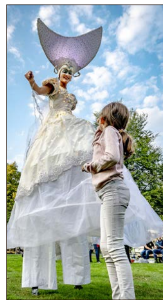
Geheimnisvolle Figuren sind beim Lichterfest im Park unterwegs.

Die Karten gibt es ab sofort in der Soltau-Touristik, Am alten Stadt-