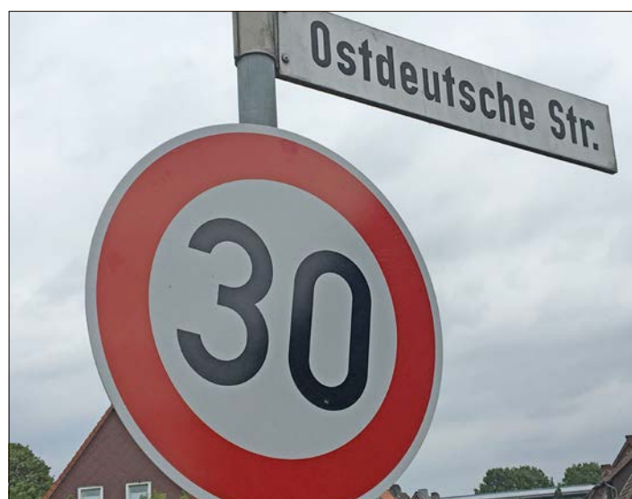
So könnte die Beschilderung am Straßennamensschild der Ostdeutschen Straße demnächst aussehen.

SCHNEVERDINGEN. Sie setzt sich dafür ein, dass motorisierte Verkehrsteilnehmer in der Ostdeutschen Straße in Schneverdingen künftig langsamer fahren: die Mehrheitsgruppe SPD/Grüne im Schneverdinger Stadtrat. Sie stellt daher zur nächsten Ratssitzung beziehungsweise Sitzung des Fachausschusses Planen, Bauen und Verkehr einen Antrag auf „Einrichtung einer Geschwindigkeitsreduzierung in der Ostdeutschen Straße auf 30 Kilometer pro Stunde beziehungsweise Prüfung einer neuen Tempo-30-Zone“.