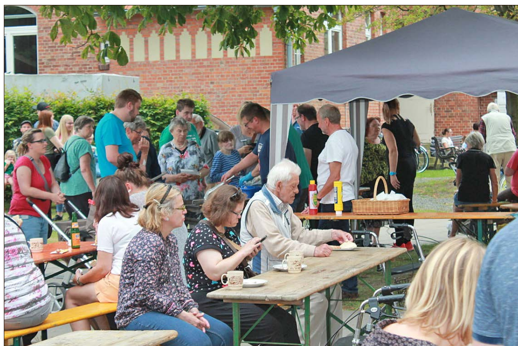
Zum Gemeindefest lädt die Soltauer Lutherkirchengemeinde nach dem Auftakt am Samstag auch am heutigen Sonntag ein.

Neu ist die Wasserbaustelle. Kinder und alle, die gerne bauen, können hier Rohre auf immer neue Weise zusammenstecken und beobachten, wie Wasser und kleine Bälle ihre Wege finden. Der Reinerlös des Gemeindefestes kommt der Finanzierung der Diakoniestelle für die Arbeit mit Kindern und Jugendlichen und der Einrichtung „Lifegate“ zugute, eine Reha-Einrichtung für körperlich und geistig behinderte Kinder und Jugendliche in Beit Jala in der Nähe von Bethlehem im Westjordanland.