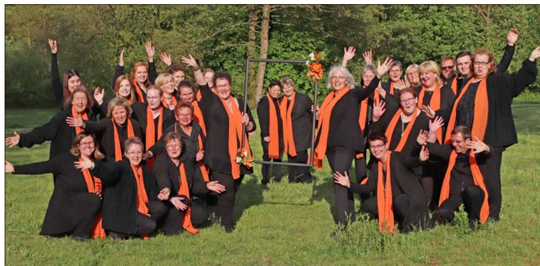
Der Gospelchor „AHAP“ wird zehn Jahre. Aus diesem Anlaß öffnet am Samstag, dem 7. September, ein „Gospel-Café“: Ab 14.30 Uhr im Ludwig-Harms-Haus in Munster, Kirchgarten. Im Rahmen der internationalen Ausstellung „Glasplastik und Garten“, die noch bis zum 8. September läuft, präsentiert der Chor im LHH Stücke aus seinem breiten Repertoire. In den Pausen können sich die Besucher nach dem doppelten Kulturgenuss stärken mit Kaffee/Tee und Gebäck - die Chormitglieder haben selbst gebacken, und so stehen mehr als 40 Kuchen oder Torten zur Auswahl. Der Eintritt ist frei, wer möchte, kann etwas spenden.