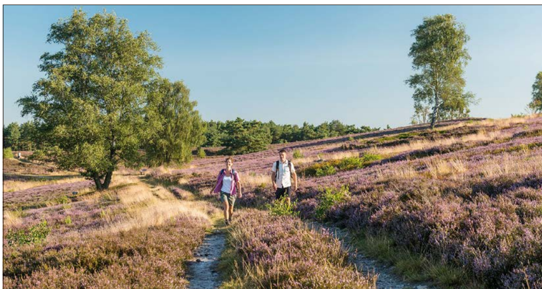
Der Heidschnuckenweg bietet ein Naturerlebnis in einmaliger weite Heidelandschaft, wie hier am Brunsberg und wurde erneut ausgezeichnet.

Heidschnuckenweg wieder auf dem Treppchen