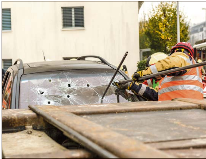
Unzureichend gesicherte Rohre auf dem Dachgepäckträger werden schnell zur tödlichen Fracht.

Auch der Zusatz „bei Nässe“ sorgt immer wieder für Irritationen: „Wann genau die Straße nass ist, schätzt nicht jeder Autofahrer genauso ein. Spätestens dann, wenn man den Scheibenwischer einschalten möchte, ist die Straße aber definitiv nass. Wie immer gilt auch hier: Im Zweifel sollte man lieber auf Nummer sicher gehen und davon ausgehen, dass die Beschränkung gilt – sonst bringt man sich selbst und andere unnötig in Gefahr“, so der Experte vom TÜV Thüringen.