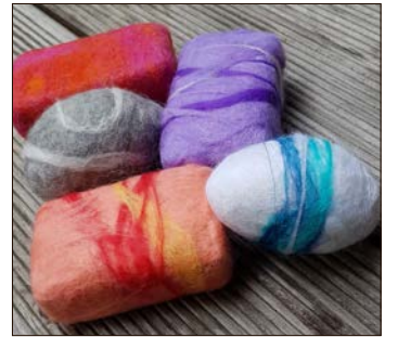
Dekoratives und Praktisches: Zwei Kurse stehen in der Soltauer Filzwelt Felto auf dem Programm.

steuermesszahl und dem Hebesatz der jeweiligen Gemeinde. Nach bisheriger Aussage der Politik soll die Grundsteuer selbst im Durchschnitt nicht erhöht werden. Dies bedeutet, Ruzyzka-Schwob, dass der Hebesatz der Gemeinden gesenkt werden müsste.